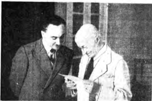
Il maestro Cilea, l'acclamato autore di «Adriana Lecouvreur» e de «L'Arlesiana» ha compiuto una gradita visita a Radio Napoli.

tizie sportive - 14.30-14.45 Musica da camera - 17 L'angolo dei bimbi, di Fata Donatelli - 17.15-17.30 Musica Jazz NAPOLE: 15.10 Cronaca napoletana - 15.20-15.30 14. Vece, Rassegnati del teatro - 17 Musica caratteristica - 17.20-17.30 Terza pagina - di L. Compagnone PALERMO: 15.13-15.25 Notiziario siciliano e cittadino - 17-17.30 Concerto del soprano Brigida Inguerra. Proietta Al pianoforte Enrico Martucci - 20.28 Musica da camera - 20.50-21.20 Attualità ROMA I: 15.13-15.20 Notiziario regionale - 17-17.30 «Ora minore» ROMA II: 14.45-14.55 «Il Rapito magico», cronache musicali di G. Rossi Dorla SAN REMO: 15.13-15.30 Notiziario e movimento del porto di Genova - 17 Popolo e musica classica - 17.20 Il gioco degli scacchi - 17.25-17.30 Richieste Ufficio di collocamento TORINO: 11, 12.10-12.20 Da «Il campionato dei telegatti» di L. Storch - 14.18 Notiziario Interv. Uigure-piemontese - 14.23 L'ultimo Borsa di Genova e Torino - 14.28-14.45 Dischi - 17-17.30 Musica sinfonica UDINE - VENEZIA - VERONA: 12.10-12.20 Cronache del cinema di Francesco Passniti - 14.18 Notiziario - 14.28 Musica leggera - 14.45-15.15 Notiziario per gli italiani della Venezia Giulia