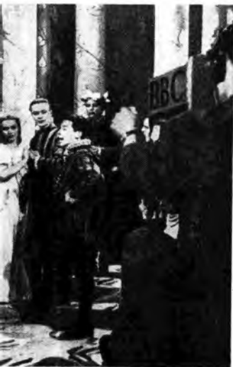
preparata dalla Compagnia inglese di Robert Atkins ritrasmessa dai microfoni della BBC.

Domenica , ore 21,50: Cabaret internazionale , orchestra diretta da Gentili (Rete Rossa) - Lunedì , ore 21: Radiorchestra diretta da Gallino (Rete Azzurra) - Martedì , ore 20,28: Orchestra Cetra diretta da Mojetta (Rete Azzurra) - Mercoledì , ore 20,28: Orchestra Ferrari (Rete Rossa) - Giovedì , ore 14,35: Sei strumenti e una voce (Rete Rossa) - Venerdì , ore 20,28: Orchestra Campese (Rete Rossa) - Sabato , ore 13,15: Orchestra Armoniosa (Rete Azzurra).