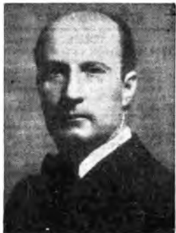
Al M° Vittorino Gui, che dirigerà un ciclo dedicato a Mozart durante il prossimo Autunno Musicale Veneziano, è affidata il concerto sinfonico di questa sera.