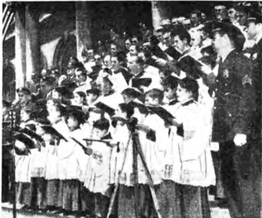
Il coro diretto da Licio Refice e costituito di cantori delle Basiliche Vaticane dà un concerto, radiotrasesso, sulla scalinata del Municipio di New York, dopo il ricevimento di benvenuto offerto dal sindaco della città

serie riuote con un sì o con un no e per le quali i numeri sono indicativi, o con il pronunciare il tanto in tanto, discussioni generati su argomenti importanti, fare degli scambi di idee, che ora vanno quasi totalmente in un solo senso. Ascoltatore Rai, udiano in due sensi, in modo che tutti possano essere guidati nelle loro obiettioni da una maggiore conoscenza delle reali possibilità della Rai e della conoscenza delle opinioni degli altri utenti diverse abitudini di vita o utenti in altre regioni. Molte critiche potrebbero trovare risposta prima ancora di essere formulate e gli ascoltatori potrebbero essere più obblitti disponendo di maggiori elementi per esprimere un giudizio. Che ci riusciamo non ne siamo certi, sarebbe presunzione da parte nostra, ma ci ispiriamo a questo che miriamo.