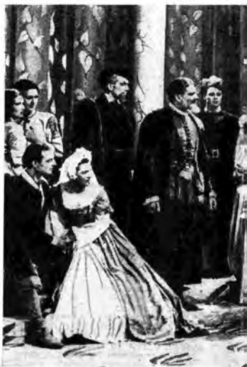
Una scena di «Come vi piace», di Shakespeare, interpretata al Teatro all'aperto di Regent's Park e