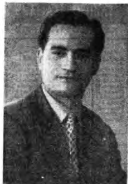
Il violinista Gennaro Rondino suona alle 21,45 di questa sera per la Rete Azzurra.