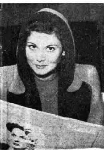
la bella stella cinematografica egiziana Raqiya Ibrahim fondata della B.B.C.

Domenica , ore 19 Musica leggera e canzoni dalla Fiera del Levante (Rete Rossa) - Lunedì , ore 22,35: Orchestra diretta da Nicelli (Rete Rossa) - Martedì , ore 13,37: Orchestra Cetra diretta da Mojeta (Rete Azzurra) - Mercoledì , ore 20,45: Echi e riflessi musicali - Radiorchestra diretta da Gallino (Rete Azzurra) - Giovedì , ore 13,15: Orchestra Armoniosa (Rete Azzurra) - Venerdì , ore 20,28: Concerto ritmo-sinfonico diretto di Segurini (Rete Azzurra) - Sabato , ore 13,25: Orchestra d'archi (Rete Rossa)