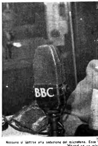
Nessuno si sottrae alla seduzione del microfono. Ecco i finanzi ad un mic

Lunedì, ore 21: Sole per due , tre atti di Bassano (Rete Rossa) - Mercoledì , ore 21.30: La scuola delle mogli , cinque atti di Molière (Rete Azzurra) - Venerdì , ore 22: Notte lunga , un atto radiofonico di Santoni Rugiu (Rete Rossa) - Sabato ,