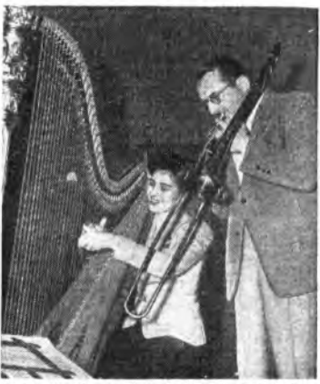
Curioso accoppiamento di strumenti ai microfoni americani: arpa e tromboni.