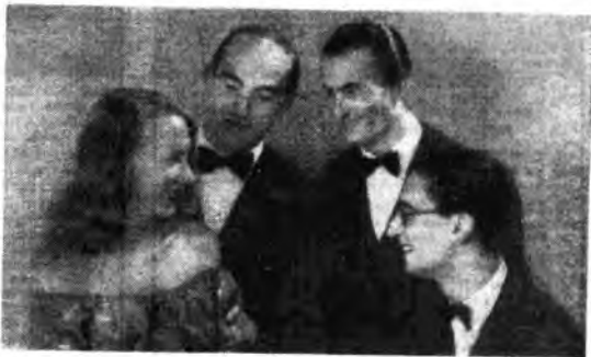
Il quartetto vocale Cetra, nella sua nuova formazione, continua ad ottenere il più vivo successo.

17,30 Parata di processi 18 Orchestra diretta da Ernesto Nicolini 18,45 Finché da camera 19 Lezione d'inglese 19,30 Terza pagina 19,45 Canzoni e ritmi 20 Segnale orario e notiziario 20,15 Musica per voi 21,15 Commedia in un