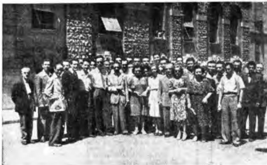
Gli allievi del corso di radiotecnica di Terni invitati da «La Radio per le scuole» visitano gli impianti trasmissivi della RAI

ANCONA: 12.50-12.56 Musica varia - 14 Listino Borsa di Bologna Dischi - 14.06-14.19 Notiziario regionale - 17.13.30 Musica commentata da Leo Donini. BARI: 11-11.30 Vecchie canzoni di successo - 15.13 Notiziario - 15.26-15.30 Notiziario per gli Italiani del Mediterraneo - 17 «L'ultima trasmissione» presentata da Aldo D'Alise - 17.15-17.21 Notiziario della Fiera del Levante. BOLOGNA: 12.50-12.56 Rassegna cinematografica - 14 Listino Borsa di Bologna Dischi - 14.06-14.19 Notiziario emiliano-romagnolo - 17-17.30 Musica commentata da Leo Donini