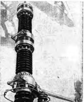
Questo modernissimo interruttore ad aria compressa è ora impiegato vantaggiosamente negli impianti di trasporto di energia elettrica ad altissima tensione.