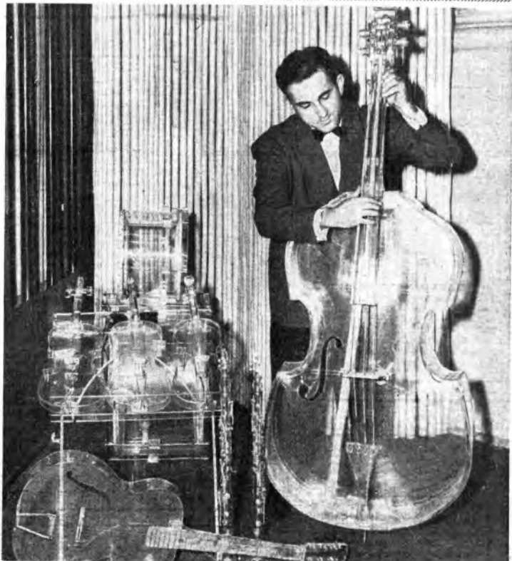
Ecco alcuni esemplari di strumenti a corda fabbricati con materia plastica trasparente. Nonostante la singolarità del materiale usato, questi strumenti sembra che uniscano alla loro leggerezza pregi musicali indiscutibili.

E infine, se questi nostri lettori ci permettono, anche un consiglio: occorre ricordare che al pari di ogni altra cosa un apparecchio radio non può durare eternamente e così verrà il giorno in cui una revisione non sarà più sufficiente per un ascolto che appaghi del tutto i desideri di un radioscrittore esigente. Quando questo giorno sia giunto, si presenterà l'alternativa: o acquistare un nuovo apparecchio, ovvero tener conto che quello di cui si è in possesso non è più in grado di offrire la musicalità primitiva.