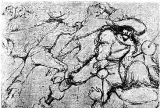
(Disegni di Rogosa)

Come già si è fatto nella scorsa primavera, in cui la RAI ha invitato gli ascoltatori a far presenti i loro desideri, e quattro tra le commedie richieste, e cioè: Addio giovinezza , Padrone delle ferrovie , Romanticismo e Nemica sono state trasmesse, anche per questa ripresa la Radio rivolge agli ascoltatori la stessa domanda e accoglierà con piacere, nel programma del Teatro Popolare, le commedie che saranno insistentemente richieste.