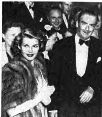
Anthony Eden e Rita Hayworth, ospiti di eccezione negli studi della B.B.C.