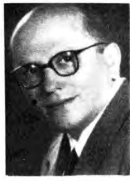
Il poeta napoletano Ettore De Mura. 1° Premio al Concorso Nazionale della Canzone E.N.A.L. con la composizione «Che bello suonano», musicata dal maestro Attilio Staffelli.