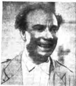
Quando Musco stesso amava e ascoltava e imitava Rocco all'imitazione (e fammi, Rocco, fammi, Rocco!).

A dieci anni di distanza la Rai vuol ricordare il grande attore con un radio-lavoro il quale, oltre a contenere squarci della sua vita ricca di avvenimenti, comprenderà anche scene salienti della commedia che egli interpretava in maniera inimitabile: San Giovanni decollato, Parainfio, Sua Eccellenza, Ridi piagiaccio, L'eredità dello zio canonico. Una specie di antologia, insomma, delle sue interpretazioni. Inimitabile abbiamo definito l'arte di Musco: pure Rocco d'Assunta, che lavoro alcuni anni accanto a lui e lo considero maestro, ridirà, in atto di umile evocazione, le parole che udiamo tante volte dalla voce di Musco. Le ridirà come