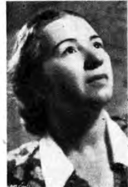
Il soprano Anna Karayannopolu collabora alle trasmissioni della Rete Rossa.

12.30 Cronache teatrali - 14.18 Notiziario regionale - 14.28-14.6 La voce dell'Università di Padova - VENEZIA: 14.45-15 Notiziario per gli italiani della Venezia Giulia - UDINE - VENEZIA - VERONA: 17-17.30 Musiche organistiche francesi eseguite da Cofredo Girard.