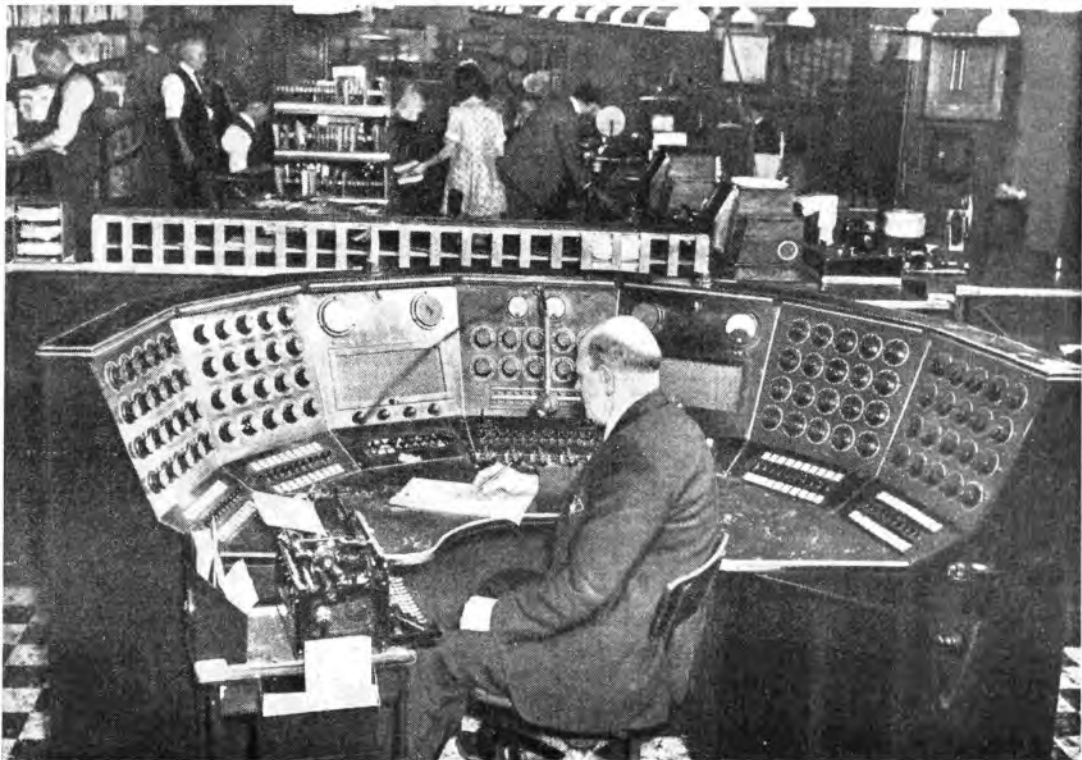
ATTRAVERSO I COMPLICATI QUADRI DI QUESTO BANCO IL SUPERVISOR DELL'IMPIANTO RADIOELETRICO CENTRALE DI NEW YORK CONTROLLA I COLLEGAMENTI REALIZZATI CON LE VARIE PARTI DE... MONDO

A PAGINA 12 E 13 ELENCO DELLE PRINCIPALI EMITTENTI EUROPEE AD ONDE MEDIE E LUNGHE