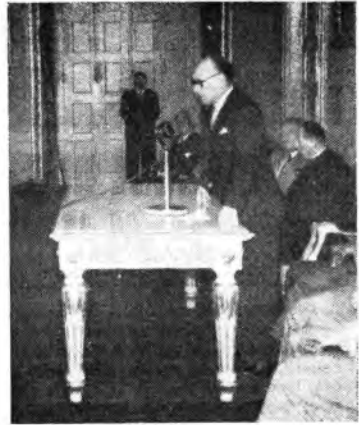
L'on. Umberto Terracini, presidente dell'Assemblea costituente, ha inaugurato a Torino i lavori del Comitato ordinatore per le celebrazioni del '48, illustrando le finalità e il significato delle celebrazioni stesse nella città che fu culla del nostro Risorgimento. L'on. Terracini si è reso anche interprete del saluto augurale dell'on. De Nicola ed ha quindi voluto rivolgere un breve indirizzo di saluto ai piemontesi nel suo dialetto piemontese.

Uno sguardo generale a questa Mostra dice, infine, che la produzione attuale è orientata verso quel tipo di apparecchio che risponde meglio alle esigenze della grande maggioranza degli ascoltatori: un apparecchio, cioè, che riceva non più che le stazioni locali, sia privo di complicati sistemi di controllo e sia dotato delle più alte qualità di riproduzione. WILLIAM S. DULL