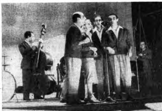
Il Quartetto Cetra, durante la trasmissione di «Arcobaleno», effettuata domenica 28 settembre dalla «Mostra delle Attività Romane» a piazzale Clodio.