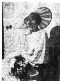
Josephine Strey, natissima cantante d'Inghilterra, interpreta questa sera alle ore 22.15 (Rete Azzurra) un programma di musiche vocali antiche e moderne. Josephine Strey ha esecuito concerti vocali con le maggiori orchestre sinfoniche d'Inghilterra e di altri paesi europei, ottenendo grandi successi.