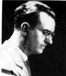
Il M. A. They collabora alle trasmissioni di Radio Genova