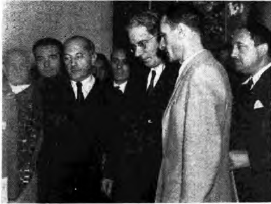
Il ministro Merlin e gli onorevoli Spataro e Brusasca, alla Mostra della Radio, stanno esaminando uno dei numerosi strumenti di misura esposti.

Con le parole del Ministro si è conclusa la cerimonia inaugurale della XIV Mostra Nazionale della Radio che ha già suscitato vivissimo interesse tra il pubblico e gli industriali e i commercianti di apparecchi radio. In una prossima occasione il proponiamo di illustrare i dati tecnici ed economici della Mostra.