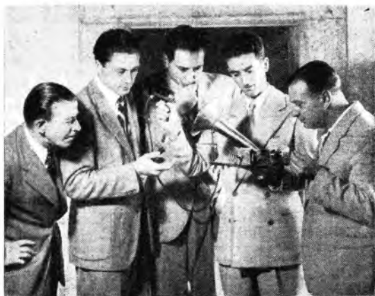
Questo poi è un gramofono cosiddetto a «Lira musicale» per essere costruito su una base a forma di lira. Esso serviva per riprodurre incisioni su dischi di cera ed è del 1889.