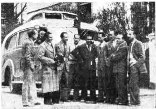
Una felice istantanea della trasmissione «Senza invito» che è stata recentemente realizzata dalla I.N.C.O.M. in un documentario cinematografico.

VENEZIA - VENEZIA - VERONA: 14,19 Notiziario - 14,28-14,45 La voce dell'Università di Padova - VENEZIA: 14,45-15 Notiziario per gli Italiani della Venezia Giulia.