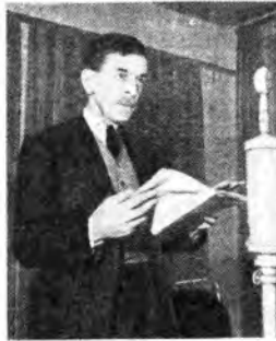
C. F. Ramuz, il poeta svizzero recentemente scomparso, è stato degnamente ricordato dalla radio della sua patria.

15.50 Concerto sinfonico diretto da Maurice Serret. 1. Mozart: Tito, ouverture; 2. Mendelssohn: Concerto in sol minore per pianoforte e orchestra; 3. Tchaikovsky: Divertimento n. 2; 4. A. Ribot: Kaa, poema sinfonico; 5. Beethoven: Faust; 6. A. Moustiquis del folclore in "Venezia sul lago"; 7. e Berceuse andante; 8. R. Strauss: Till Eulenspiegel, poema sinfonico. 18.20 Tra le danze. 19 Notturno 19.05 Fando incanteato. 19.30 Varietà. 20.05 All'Albergo del ritmo. 21.02 Notturno 21.35 e la dame palatin di Brantôme, due opuscoli di René di Maurice Thibaut, un libretto di Raimu Godebour; 1. e Le Amant; 2. e Il Des-