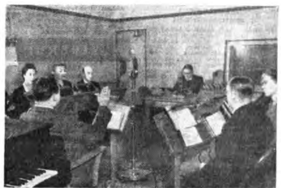
Il servizio religioso dagli studi della B.B.C.