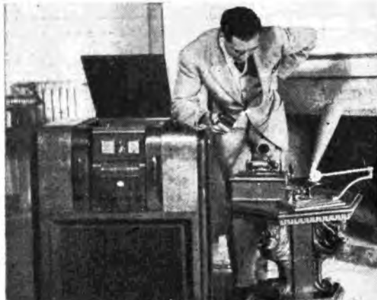
Un moderno radiofonografo accanto a due suoi antenati: un fonografo a rullo di cera e uno dei primi fonografi a disco. Per uno strano miracolo i due apparecchi funzionano ancora.

Tutto questo è stato riprodotto in un originale Documentario che la Sezione Radiocronache e Attualità ha effettuato presso la Discoteca di Stato e trasmesso sulle stazioni della Rete Rosso