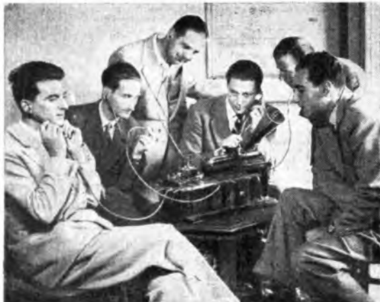
Questo «ciclope» di meccanica è un fonografo inventato da Thomas Alva Edison nell'anno 1878-1888. Vero capolavoro dell'epoca, funziona elettricamente, l'audizione viene fatta a mezzo di tubi di gomma applicati a speciali pipette di ebanite.