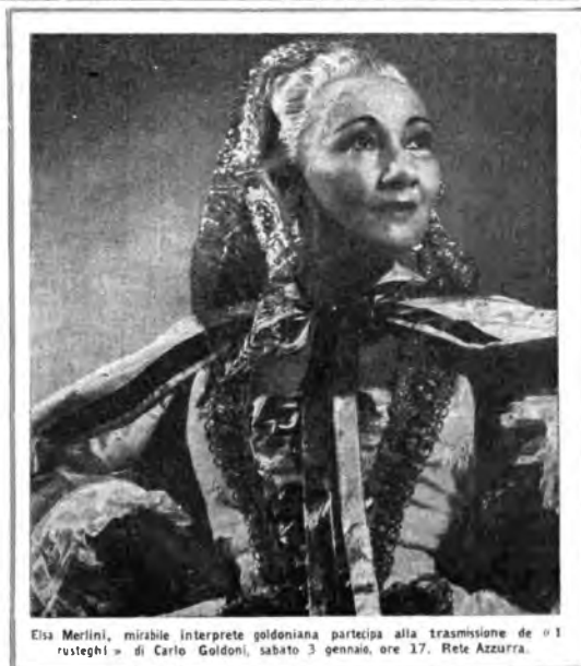
Elsa Merlini, mirabile interprete goldoniana partecipa alla trasmissione de «I rusteghi» di Carlo Goldoni, sabato 3 gennaio, ore 17, Rete Azzurra.