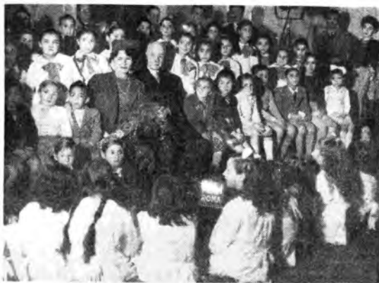
Il Ministro di Danimarca a Roma S. E. Otto Carl Mohr, con la sua signora a Radio Roma durante la registrazione del programma dedicato alla Danimarca.

«Ma quello che, secondo il mio parere, è in special modo più degno di rilievo e più bello, è che moltissime fra le famiglie danesi che hanno accolto i bambini erano famiglie che vivevano loro stesse in modeste condizioni,