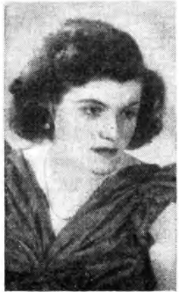
Il soprano Naja Berowska ha recentemente eseguito un concerto di musica da camera ai microfoni della Rete Azzurra

ANCONA 12,25 Orizzonte sportivo - 12,35-12,45 Notiziario marchigiano - 14-14,05 Dischi. NARI I: 12,25-12,35 «Domani e fatti di Puglia» - 13,15 Notiziario - 15,20-15,30 Notiziario per gli italiani del Mediterraneo. NOGARA I: 12,45-12,56 Considerazioni sportive di L. Clerici - 14-14,19 Dischi e Notiziario. ROLANDI: 8,20-8,30 Notiziario locale - 12 Trasmissione latina - 12,15-12,56 Programma in tedesco. Comunicati - 18-20 Programma tedesco. CATANIA: 12,25-12,35 Notiziario regionale - 15,15-15,20 Notiziario - 20,30 Motiv di successo - 20,45-21 Notiziario e attualità. FIRENZE I: 8,20-8,22 Bull. orofortitico - 12,25-12,35 Notiziario medico - 14,20 Notiziario - 14,30-14,45 «Tre re mi» cucini musicale. GENOVA I: 12,25-12,35 Problemi cittadini - 15,15-15,17 Monumento 49° porto. GENOVA II: 14,20-14,30 Notiziario interregionale liguro-piemontese. MILANO I: 12,25-12,35 «Oggi a...» - 14,20 Notiziario regionale - 14,30-14,35 Rassegna sportiva.