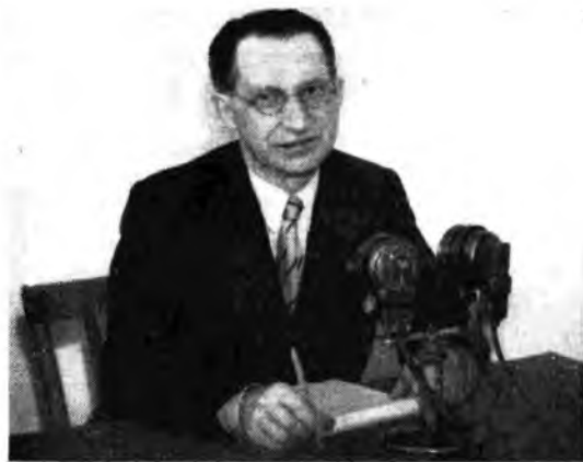
L'on. De Gasperi legge alla radio l'appello del Consiglio dei Ministri per il Fondo di Solidarietà Nazionale