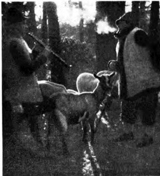
In occasione del Natale si ripete a Thiene ogni anno una caratteristica manifestazione di folklore: va sotto il nome di «Canti della Nina» ed avete avuto modo di ascoltarne la radiocronaca.

Nello stesso concerto, insieme al Don Giovanni , moltissimo capolavoro della produzione sinfonica di Strauss, si ascolterà l'allimo dei suoi poemi sinfonici, la vasta e grandiosa Sinfonia delle Alpi (1915). Nonostante l'ingenuità dell'assunto descrittivo (si tratta di raccontare in tutti i suoi particolari le vicende di un'escursione alpinistica, a cominciare dall'altissima ciuffa mattutina, poi l'ardore impetuoso della prima salita, il graduale mutare del paesaggio che si fa dapprima pastorale e idillico sempre più severamente alpino, l'affanno del sentiero smarrito in mezzo ai cespugli, la disumana e caudata maestà del ghiacciaio, la cautela dell'arrampicata su roccia e perfino il brivido del piede messo in fallo, la conquista della vetta con una estatica e gloriosa visione, poi il ritorno, dove il tema dello salita ritorna rovesciato, il temporale, il tramonto e il riposo serale all'ombra maestosa della montagna, il cui tema si profila un'ultima volta nella bruma sonora come la montagna stessa con la sua imponente mole nelle tenebre della notte), nonostante l'ingenuità dell'assunto descrittivo e la traboccante pienezza strumentale, è un'opera forte e sincera, dove circola veramente l'aria sana e frizzante dell'alta montagna e dove si esprime il dinamismo ottimistico ed attivo dell'autentico alpinista. m. m.