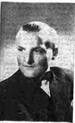
Il giovane direttore d'orchestra danese Arne Hammelboe dirige un concerto di musica danese contemporanea sabato, alle ore 17, per le stazioni della Rete Rossa.

La sostanza musicale di questo lavoro, se pur sono in qualche parte d'essere sottratta all'azione per la quale fu concepita, vive di una sua autonoma validità, percepibile attraverso la saldezza degli elementi melodici, armonici e ritmici. Un'opera di gusto e di evoluta fattura, intelligentemente espressiva degno in tutto dell'artista che nel campo delle lettere ha già dato di sé prove così alte ed originali.