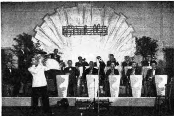
L'Orchestra Gimelli vincitrice della BACCHETTA D'ORO 1947.

Non è chi non veda l'interesse e l'importanza dell'iniziativa perchè in tal modo viene a crear-