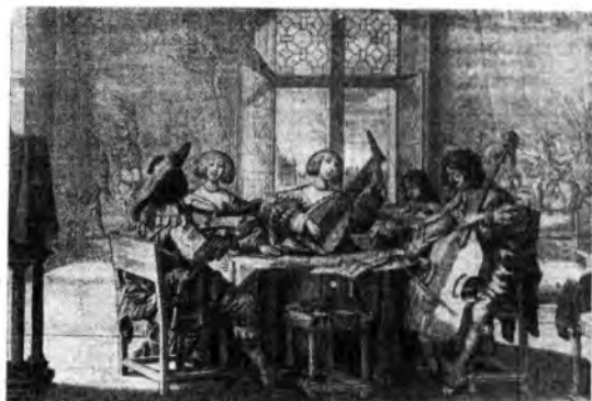
Riunione musicale nel '600 (da un documento di proprietà della Biblioteca di S. Cecilia).

Che di già, che da tempo — anzi — i maggiori enti radiofonici del mondo si sono in vario modo adoperati a tale compito, non solo le cronache ma gli stessi risultati concreti delle loro attività ne recano conferma. Che in particolare cura la Radio Italiana abbia avuto ed abbia di continuo le trasmissioni di cultura musicale, dalle grandi opere e di enfonia alle molteplici rubriche speciali di presentazioni e commento ed ai resoconti critici settimanali, è anche più noto. L'esplicita integrazione del quadro RAI con un programma d'indole