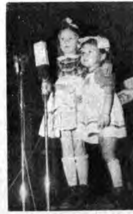
Due bimette goicache si accostano per la prima volta al microfono nella tradizionale «Festa di Sermone» tenutasi recentemente a Roma in S. Andrea della Valle.

ta alla ribalta, ha dovuto acciambare nel fango, si sente disperatamente vinta. Poi, quasi per istinto di conservazione, sebbene abbia spergiurato di staccarsi dall'ingannatore, si rassegna, per non perderlo, a fingere di non saperne nulla, a sopportare quell'altra, ad accontentarsi delle ore rubate a lei. Ma le sfuggono di bocca parole imprudenti, che fanno capire all'uomo che ella ha osato accostarsi a sua moglie. Atterrito che ella abbia parlato e distrutto la sua felicità domestica, la insulta, la maltratta, le fa crudelmente intendere che la moglie è il suo affetto tenace e profondo e rispettabile, non lei. E Zaza ritorna al suo destino, ai teatrali, alle musicchette, alle biacche, ai balletti, alle gonnelline succinte; e diventa celebre, e dopo molti anni, incontra il suo amante di allora. Si parlano con un po' di tristezza, e si salutano per non rivedersi mai più. Si comincia con Sardou e si vi- a finire cogli «Amanti» di Donnay.