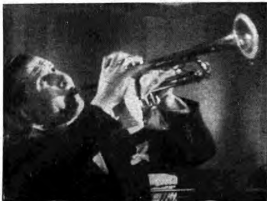
Gaetano Gimelli virtuoso della tromba, in un «a solo».