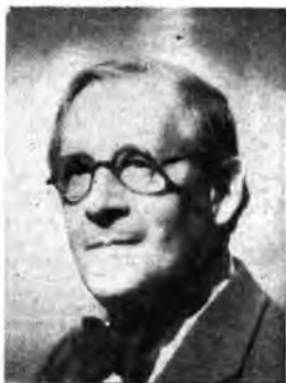
Il maestro Engelbrecht dirige, venerdì alle ore 21, per la Rete Azzurra, un concerto di musiche di Ravel nel decennale della morte dell'autore.

Di questa sia poetica Ravel era, perfino con la sua persona fisica, il vivente commentario: è ormai un momento classico, o leggendario, della nostra coscienza di uomini moderni quel suo volto affilato e preciso, come un profilo di medaglia, dalle labbra sottilissime strette intorno alla sigaretta, coi grigi capelli stempiati, tendenti al bianco, eppure fino all'ultimo giovanili. E in tutta la persona un piglio aristocratico di gentiluomo, ma non dell'antica, sempre un po' distante, cortese, riservato. Sempre in uno stato di difesa permanente contro le indiscrezioni psicologiche e sentimentali del prossimo, tracciava una frontiera inviolabile tra la propria personalità interiore e la parte di se stesso che concedeva agli altri.