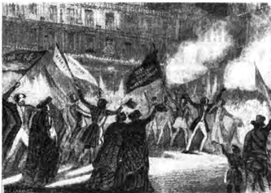
Da una stampa dell'epoca: esultanza di popolo nella piazza del Palazzo Civico di Torino all'annuncio della concessione dello Statuto. L'evento della proclamazione dello Statuto sarà rievocato in una trasmissione radiofonica che avrà luogo sabato 6 marzo, alle ore 20.40, per la Rete Rossa.

Nel programma o calendario di queste radioevocazioni si avvicenderanno le città d'Italia che dettero il maggior concorso di