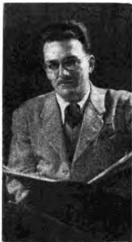
Il maestro americano Sigisnd Skubikowski - Direttore della Civic Opera di Chicago - che ha diretto, per la Rete Rossa, un concerto sinfonico di musica contemporanea degli Stati Uniti.