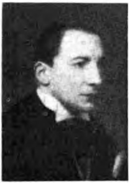
Il M. Francesco Molinari Pradelli che dirige un concerto sinfonico per la Rete Azzurra venerdì alle ore 21.

Nelle altre due Odi , alla Pace e alla Libertà, che già hanno avuto il loro battesimo radiofonico, il coro si unisce all'orchestra nell'umana invocazione ai due supremi beni agognati e raggiunti.