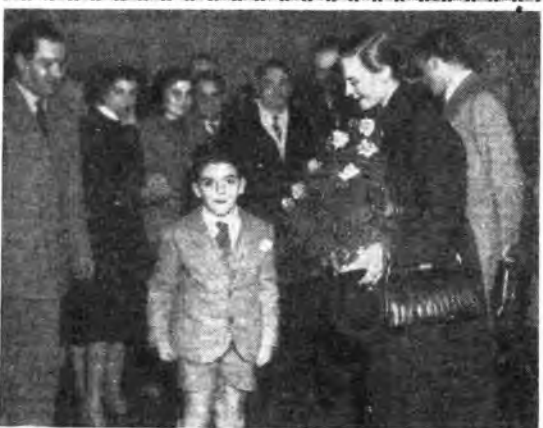
Omaggio di fiori a Michèle Morgan che ha partecipato a una trasmissione di Arcobaleno a