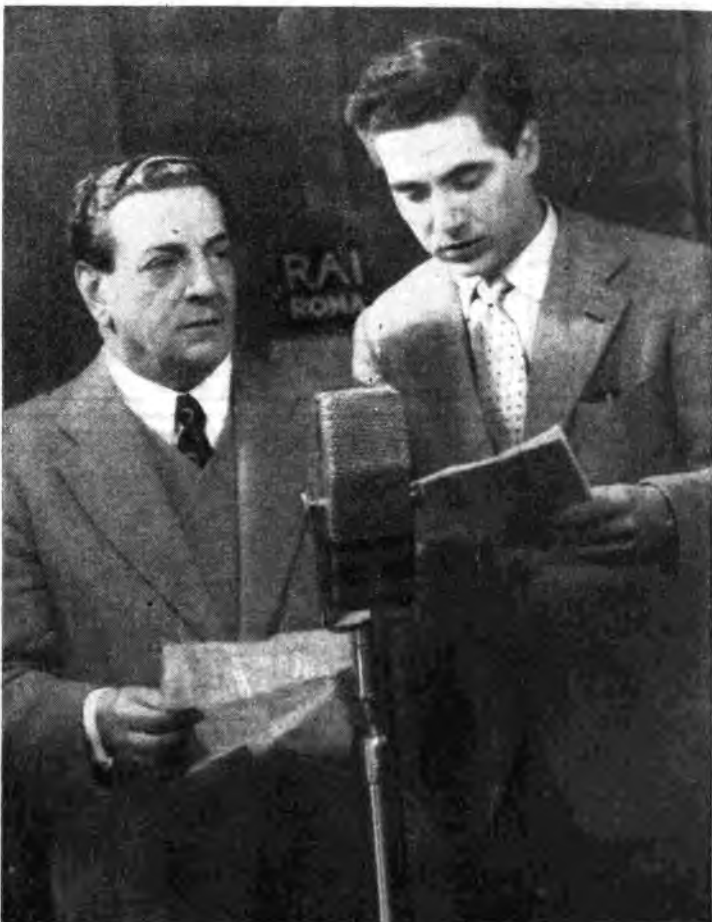
TITO SCHIPA RACCONTA A «RADIOFORTUNA 1948» L'AVVENIMENTO PIÙ FORTUNATO DELLA SUA VITA

Dal Teatro dell'Opera di Roma: LOUISE , di Giorgio Charpentier (Sabato, ore 21, Rete Rossa)