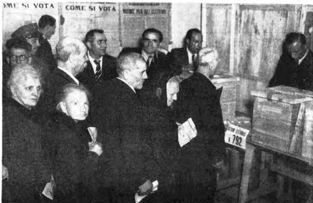
18 Aprile: Il popolo italiano è chiamato a votare - Il giornale radio darà comunicazione di volta in volta dei risultati elettorali

IL CONTE DI LUSSEMBURGO , operetta di F. Lehar (Domenica, ore 21, Rete Azz.)