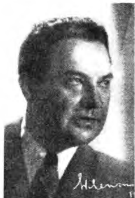
Il soprano Mafalda Favero ed il baritone Alessandro Sved che partecipano al concerto vocale Martini e Rossi di lunedì (ore 21 Rete Azzurra).

possa godere della gloria, non offuscata da quella del suo maestro. Non solo, ma consente anche alle nozze con la nipotina.