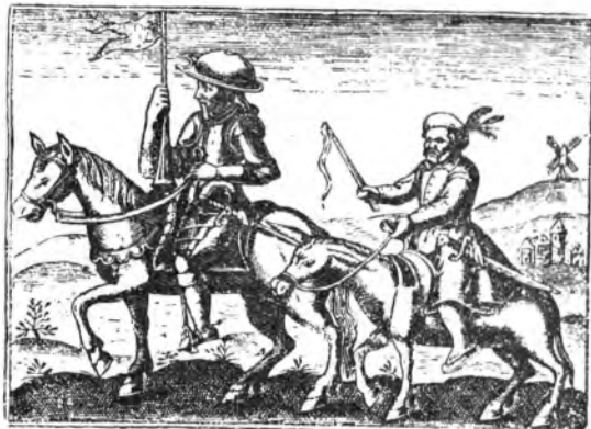
Don Chisciotte e Sancho Panza da una stampa parigina del 1622.

Sciolto, che ebbe rapido e cordiale diffusione (e fu scritto intorno al 1922) è significativo di ciò che Ibert aveva dentro di sé e di ciò che avrebbe abbandonato: certo composto, realistico colorismo alla Chabrier, l'evidenza qualche lineamento veristico fissato da una memoria crudamente curiosa, ripagano in partenza il persistere di un richiamo — ancora vicino — ad esperienze sconciate. E non con la volontà di sottrarsi per forza a suggestioni insopprimibili, ma con un misurato aggiungere conquista a conquista nell'attesa del momento di maturazione; il quale venne per gradi, ma si affermò inequivocabilmente con i lineamenti di una precisa chiarezza francese. Da più di vent'anni a queste parti si sono andati infatti definendo in Jacques Ibert con una progressione risoluto-