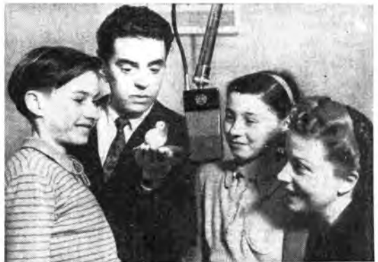
Molti bambini scrivono di non credere che nella trasmissione del «Grillo parlante» sia davvero l'uccellino della radio a narrare al microfono, quanto ha visto fare di buono e di cattivo da parte dei suoi piccoli amici. Per gli increduli dunque, ecco «Luccellino» sorpreso durante una trasmissione, quando proprio fa le sue grate ed ingrate confidenze.

urgono su di lui, sulla sua coscienza; inconsciamente vorrebbero ricondurlo all'antica personalità, alle antiche passioni, lo assediando di particolari, di memorie, ricercano nella sua coscienza le condizioni in cui altre volte egli, la madre che non sapeva amarlo, la cognata che non sapeva rifiutarsi a lui, la serva che sedusse, l'amico che ferì. Fra queste voci, una sola è vera voce d'amore: quella del fratello, che offeso dall'antico Jacques nel più crudele dei modi, pure ha compreso e perdonato, ha continua-