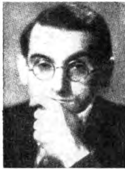
Jean Anouilh, uno dei maggiori e più originali commediografi della Francia d'oggi.