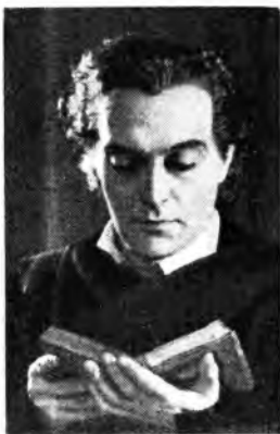
Renzo Ricci, l'applaudito protagonista delle maggiori opere shakespeariane interpretate l'«Amleto», sabato 24 aprile, ai microfoni della Radio Italiana per gli ascoltatori del Teatro Popolare.

È un pesante bagaglio che dovrebbe caricare sulle sue spalle; egli, uomo nuovo, con una verginità nuova, con un passato nuovo ed immacolato, egli che diciotto anni ha vissuto in libertà, senza ombra, senza peccato, senza rimorso. Implacabili i parenti premono.