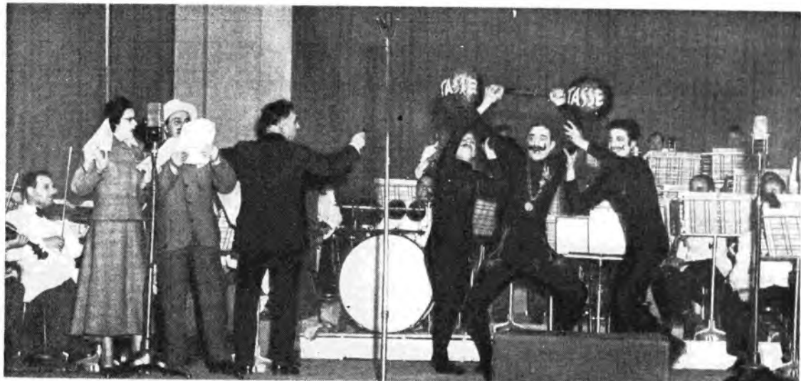
Il Trio Vigor nei suoi atletici sforzi a suon di musica