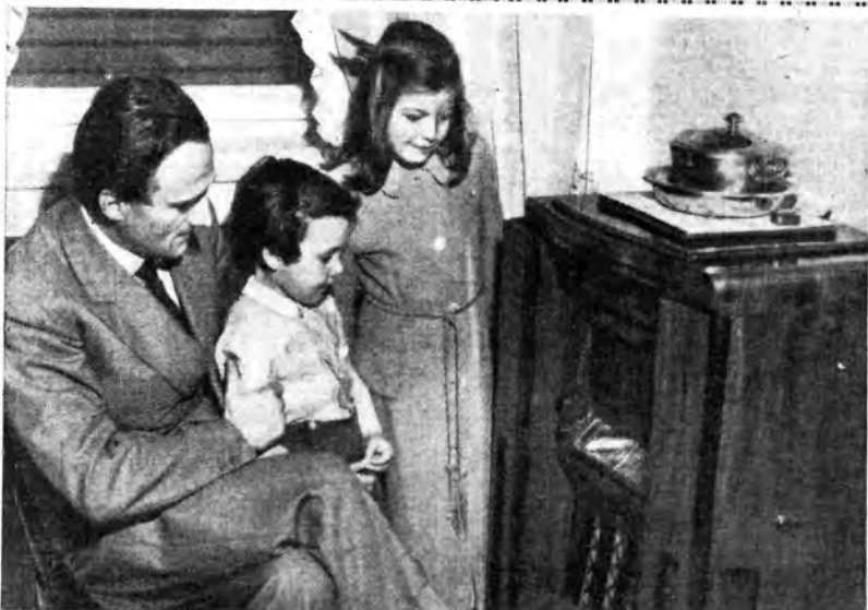
Il figlio e i nipoti del Sen. Enaudi ascoltano alla radio le vicende delle votazioni parlamentari che hanno portato il loro illustre Familiare alla dignità di Presidente della Repubblica Italiana.