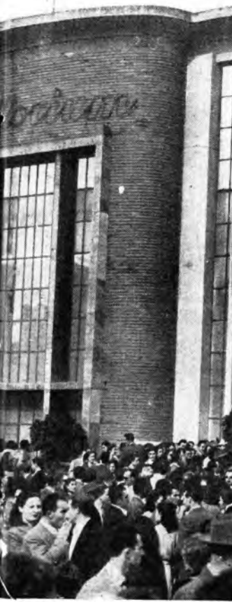
Ressa di folla dinanzi all'ingresso dell'Auditorium