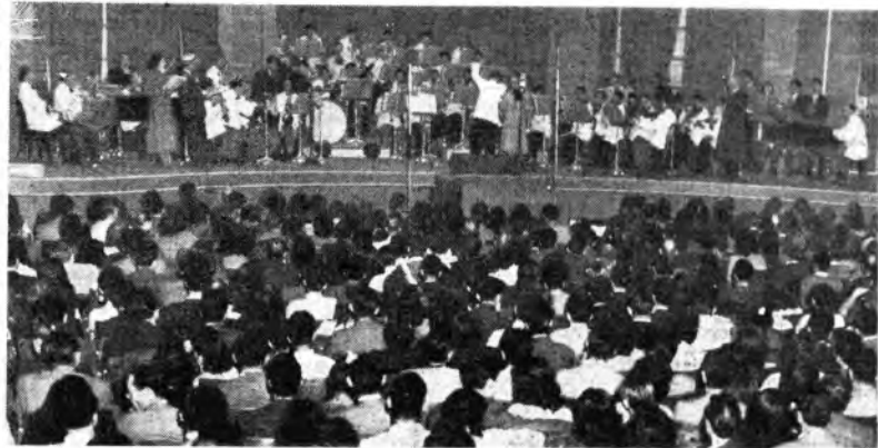
Nella sala dell'Auditorium « tutto esaurito » in ogni ordine di posti