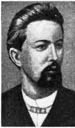
Anton Cecov, il grande scrittore e commediografo russo, del quale la Rete Azzurra trasmette giovedì sera «Il Gabbiano».