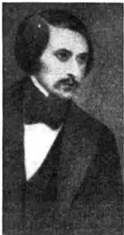
Nikolai Gogol, il cui capolavoro «Il Revisore» verrà trasmesso giovedì (ore 21.10 - Rete Azzurra).

In Ostrowski, che era veramente un rievocatore di costumi, non era accaduto niente di tutto questo e se egli denuncia i cattivi funzionari, subito compie il quadro col rievocare le reazioni, le cause, giustificative, le malizie, le cattiverie anche da parte delle vittime di quei cattivi funzionari. Cosicché dalle sue commedie balza vivo appunto un quadro di costume, quasi una storia romanizzata e legata in mille modi ad accidenti obiettivi. In Gogol, che della sua vita, non alla ricerca del male per debellarlo. Ed è proprio questo cinismo senza quartiere che ci dà la chiave per entrare nella psicologia di Gogol. Al di là del realismo, al di là del caricaturale e del grottesco, si indovina la preoccupazione metafisica dell'autore.