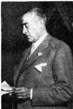
Il Ministro delle Informazioni della Repubblica Argentina Emilio Cipolletti al microfono di « Arcabaleno ».