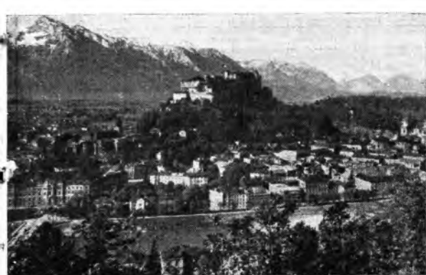
Per Austria s'intende quasi sempre Vienna. Ma anche le altre città hanno le loro particolari tradizioni: prima fra tutte Salisburgo, sulla quale sembra ancora aleggiare lo spirito di Mozart