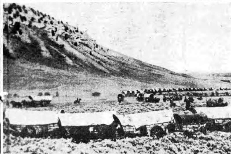
«(a sinistra) Gli Stati Uniti d'America non sono solo Hollywood o Wall Street: v'è anche una terra aspra e matigna sulla quale lottarono i pionieri per aprire la via alle attuali opere di civiltà.