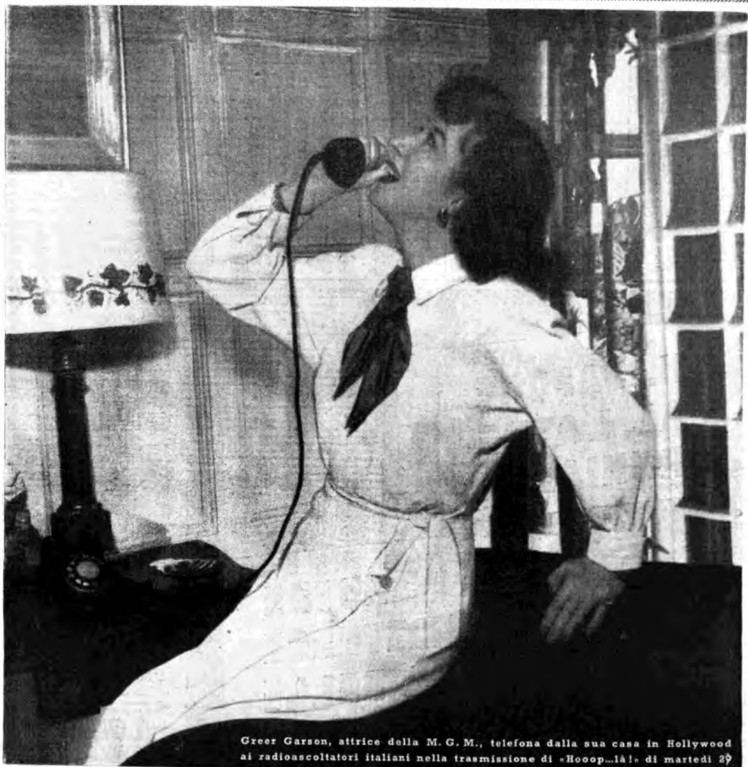
Greer Garson, attrice della M. G. M., telefona dalla sua casa in Hollywood ai radioascoltatori italiani nella trasmissione di «Hoop...là!» di martedì 29