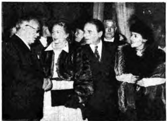
Artisti del Cinema e della Radio francesi in visita domogio al Presidente della Repubblica Vincent Auriol (da sinistra a destra): Josette Day; Pierre Blanchard; Marie Dubas.

influsso sugli uomini che operano il Risorgimento, anche su uomini loro avversari, appunto perché la sua poesia desto o esalto in loro un senso acutissimo della dignità umana, e il bisogno di erasmarchate: le insidie della quotidianità accommodate, e l'ansia di realizzare il meglio di sé in una società che di meglio fosse opera e specchio. Ma se hanno torto coloro che lo considerano una specie di alto propagandista di idee libertarie, uno sceneggiatore di trame miranti a precisi