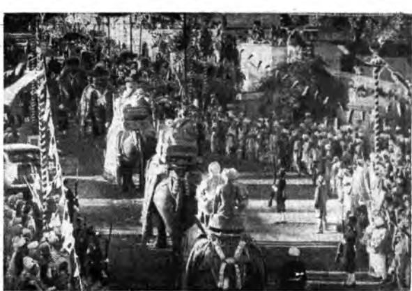
«(in alto) L'antichissima India, erogiole di razze e di religioni, ci attira con il fasto pellegrimo dei suoi riti complicati e curiosi e delle movimentate correnti.