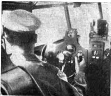
Il pilota dell'aerosecoursa « Cant Z 506 » in volo di ricerca.