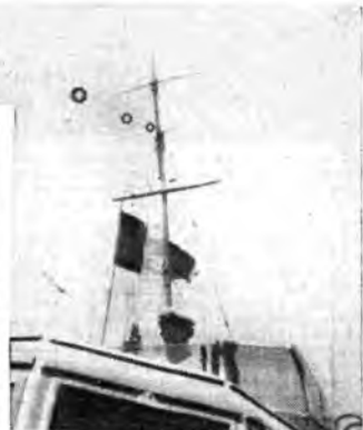
Un radio-appello è stato captato da pochi minuti e già un motoscafo d'alto mare ha ricevuto l'ordine di dirigersi a tutta velocità dove è richiesta la sua provvida opera di soccorso.