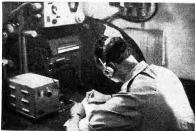
Pervengono al marconista del motoscafo d'altomare « Amma 1050 » i primi segnali di soccorso.

Una giovane donna che stava per morire di parto nella sperduta isola di Ustica è stata salvata quasi miracolosamente, grazie a un appello radio raccolto dal Centro Internazionale Radio Medico di Centocelle. I particolari dell'avvenimento che ha commosso l'opinione pubblica sono noti. Quel che non è abbastanza noto è, invece, il funzionamento del C.I.R.M. che agisce in collaborazione con il Centro aeronautico di ricerca e soccorso che ha pure sede a Centocelle.