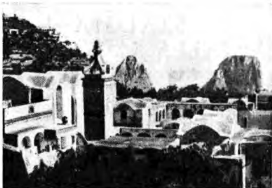
La Certosa di San Giacomo nel cui Chiostro avranno luogo alcune delle manifestazioni musicali inedite in onore dei partecipanti al Convegno Radiofonico Internazionale.

Mani esperte e sagaci sono state incaricate di frugare negli archivi dei Conservatori e delle Biblioteche per ricondurre alla luce preziosi spartiti musicali del 1600 inediti. Nella Biblioteca del Conservatorio di Bologna sono state ritrovate musiche di Bigio Marini, nato a Brescia nel 1597 e morto a Venezia nel 1685; del bolognese Giuseppe Jacchini, che fu celebrato violoncellista della Collegata di San Petronio fra il '600 e il '700; del pioliese Francesco Manfredini, nato nel 1688 e probabilmente morto in Germania dopo il 1711. Nella Biblioteca Nazionale di To-