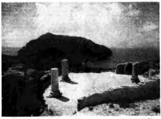
Una suggestiva inquadratura dell'isola di Capri, ripresa dalla celebre Villa di Tiberio. Sullo sfondo è il Monte Solaro.