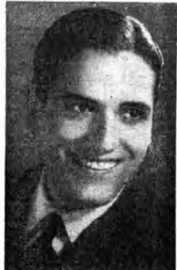
Il pianista Franco Mannino interpreterà il «Terzo concerto per pianoforte e orchestra» di Beethoven venerdì alle 21.15 dalla Rete Azzurra.

«La Quinta sinfonia» scrive Biamonti nel suo «Beethoven» — sta al centro dell'opera beethoveniana dal doppio punto di vista tecnico ed estetico. Per la vicenda passionale che, all'inverso gli stadi d'animo contemplativi, ricchi di luce e d'ombra del secondo tempo, e le fantastiche violini del terzo, collega in un rapporto ideale di antecedenza e di conseguenza i due tempi periferici, essa è stata molto volte considerata come espressione, nel campo dell'arte, del dramma dello spirito umano anelante ad una vittoria e ad un superamento che infine raggiunge e celebra con entusiasmo pari alla violenza dei contrasti. Hanno scritto a lungo su questo concetto, tra i tanti, Wagner e Schuré. Può interessare anche il ravvicinamento, cui accenna lo Chateaubriand, del Finale con quello del Fidello , pure in do maggiore , composto da Beethoven nel medesimo periodo di tempo».