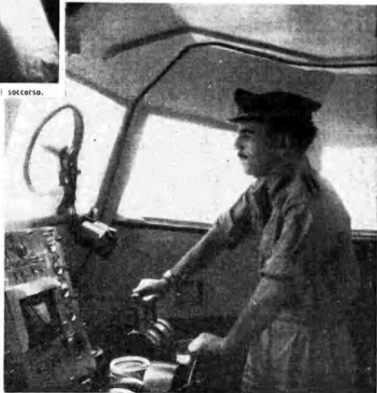
Il pilota dell'« Amma 1050 » al suo posto in cabina, durante una normale crociera di perlustrazione in una zona del Mediterraneo.