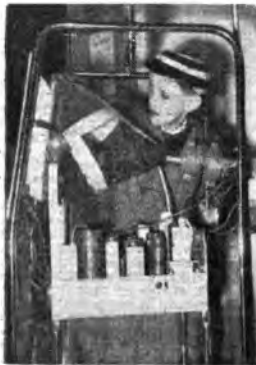
In una scuola britannica un futuro tecnico della radio si addestra nei segreti della televisione.