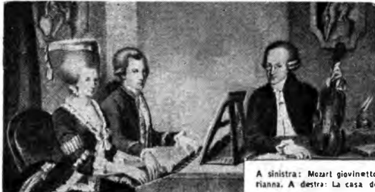
A sinistra: Mozart giovanetto al cembalo con la sorella Marianna. A destra: La casa del padre di Mozart a Salisburgo.

Energico collaudo dell'orchestra, da poco radunata dopo le ferie estive, il poema sinfonico Don Giovanni di Strauss chiude in bellezza l'interessante ed equilibrato programma.