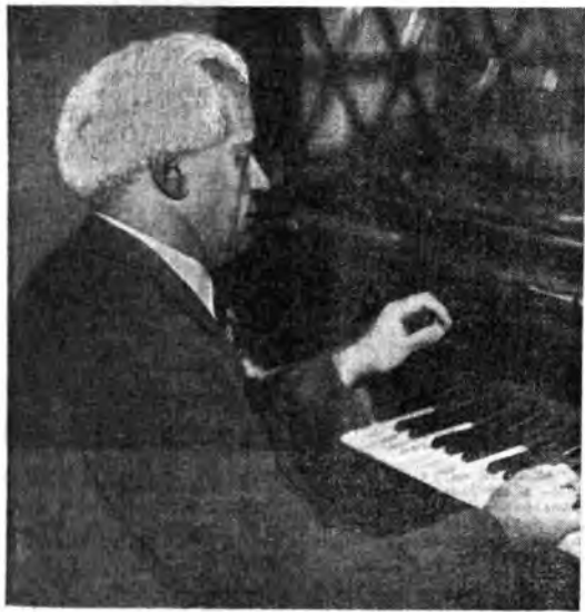
Nel concerto trasmesso dal Festival di Lucerna mercoledì alle 21.15 dalla Rete Rossa gli ascoltatori avranno modo di ammirare ancora una volta l'arte raffinata ed esperta del pianista Wilhelm Backhaus nell'esecuzione del «Concerto in si bemolle maggiore» di Brahms.

di carattere cromatico. Nella avviluppata entra una nuova figura: le quattro note famose (fa, sol, si bemolle, la) che hanno tanta parte in tante opere di Mozart. L' Andante , in si bemolle, si inizia con un tema idillico nel quartetto; segue un secondo tema, in do minore , nel primo violino. Lo sviluppo si basa su un altro tema contrappuntistico attaccato dai primi violini e quindi f. bensì. Benché il Minuetto sia stato composto in epoca posteriore (non figurava infatti nella prima redazione della sinfonia e fu aggiunto da Mozart durante il suo soggiorno a Vienna)