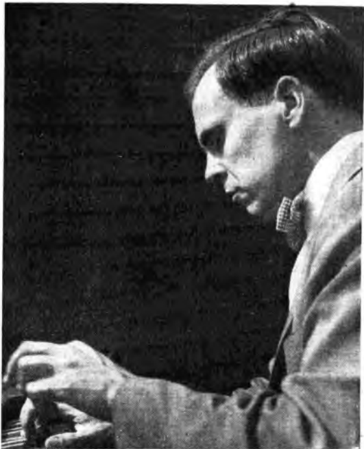
Ralph Kirkpatrick, il più eminente clavicembalista d'America, suona sul clavicordo musiche di Bach giovedì dalla Rete Azzurra. Oltre che valoroso concertista, Ralph Kirkpatrick è un profondo studioso di musiche antiche alle quali ha dedicato, dal 1938 al 1942, e in seguito nel 1946, un festival che si è periodicamente svolto a Wilhamsburg negli Stati Uniti.

E si trattava di un soggetto senza forti situazioni e senza alcuno di quei giochi di contrasto che tanto peso hanno talvolta nella fortuna di un lavoro teatrale! Ma di una storia delicata e gentile: la storia dell'amore che fiorisce tra una fanciulla timida e ingenua e un ricco signore di campagna, che, dopo essersi proclamato sempre un nemico accerrimo del matrimonio, finisce invece, con la complicità sorniona di un suo buon amico, a prender per la ragazza una cotta formidabile, che lo conduce dritto dritto al matrimonio. Una storiella, come si vede semplice, ma che ha offerto alla giovinezza di Pietro Mascagni la ispirazione di una fiorita di canti che hanno respiro e fragranza di primavera e baleni dorati di sole. E l'opera vinse e vince per questo impeto fresco di giovinezza.