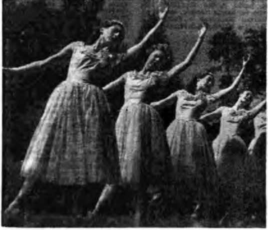
Giovani allieve di una scuola di danza che si esercitano all'aperto seguendo i ritmi di una radiotrasmissione.

Perché si suppone, e le statistiche confermano la supposizione, che il numero degli ascoltatori che si interessano alla musica è superiore, di molto superiore, a quello di coloro che si interessano alla letteratura. Questo, naturalmente, in rapporto alle trasmissioni radio.