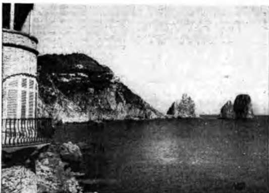
Dalle acque profonde del mare di Capri si innalzano i Faraglioni, antenne ideali del Convegno Radiofonico Internazionale.