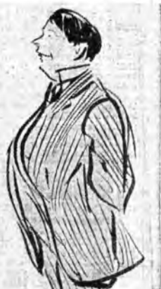
Fasquariello, il più popolare e famoso interprete della canzone napoletana, ha assicurato il suo intervento al «trasmisjone»