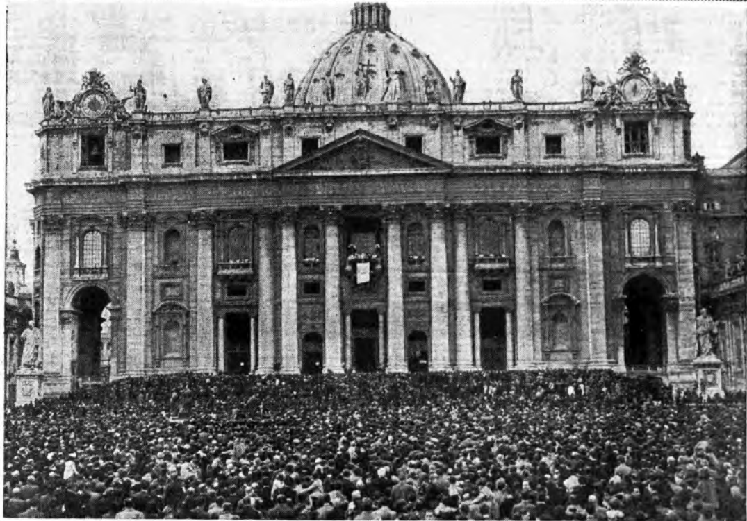
Il 5 ed il 12 settembre verranno radiotrasmesse da Piazza S. Pietro due allocuzioni che il Santo Padre pronuncerà alle rappresentanze della Gioventù Cattolica femminile e maschile convenute a Roma per celebrare rispettivamente il trentennio e l'ottantennio della loro fondazione.

Dal Teatro La Fenice di Venezia: XI Festival Internazionale di Musica Contemporanea - CONCERTO SINFONICO diretto da Arthur Rodzinski (Lunedì ore 21,15 - Rete Azzurra)