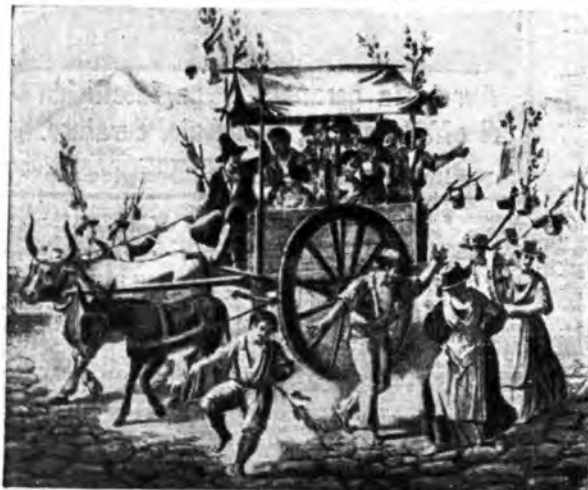
La rustica «carretta» è stata fin dai tempi antichi il modesto ma tradizionale mezzo di trasporto alla Sagra delle famiglie partenopee