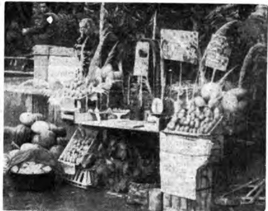
Le «bancarelle» colme dei frutti della fertile terra napoletana completano la gioia di questa manifestazione