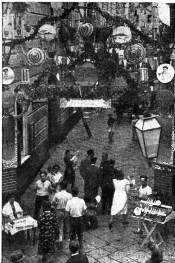
La «estrosità» popolare trova infinite e foccanti espressioni. Le vie non potrebbero contenere altri canti, altra comune e vertiginosa spensieratezza