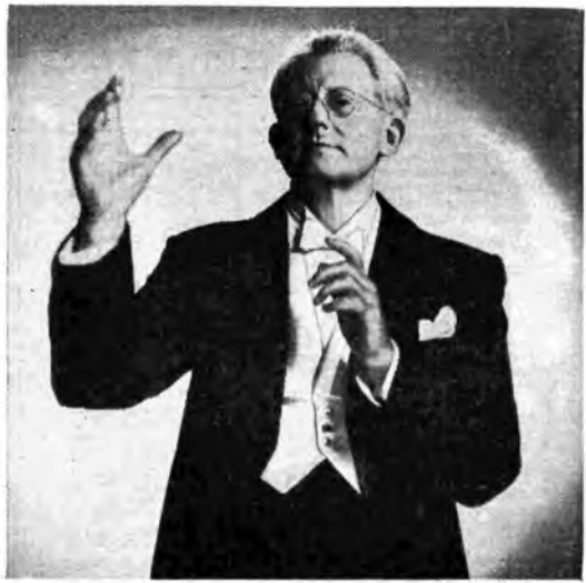
Arthur Rodzinski dirige il concerto sinfonico di lunedì dal Festival di Venezia, che sarà irradiato dalla Rete Azzurra.

aveva esitato a proclamare, nell'altro dopoguerra, il « principe della musica moderna », è ritornato a far parlare di sé in questi ultimi anni, dopo un periodo di silenzio e quasi di oscuramento. La Suite sinfonica , scritta nel 1946 è un pezzo serio e severo, di nobile sostanza, sebbene oppale lontano dalla drammaticità e dal fervore biblico dei lavori blocchiani di un tempo. In America è stato detto ch'essa conserva di Bloch il vigore giovanile e l'intensità, senza gli isterismi In Inghilterra qualcuno ha parlato di musica un po' fredda e impersonale, dove sole certe caratteristiche armonie di quartie rivelano la firma inconfondibile dell'autore. Certamente la Suite , con le forme classiche dei suoi movimenti, segna un ulteriore passo nella riconciliazione con la tradizione, avverte da Bloch nel suo periodo neoclassico. L'ampia e solida Ouverture è concepita come un libero fugato il cui tema è talmente variato ad ogni apparizione, che se ne trae un costante senso di progresso. La Pasacaglia consta di 22 brevi variazioni sopra un basso fondamentale, ed il pro-