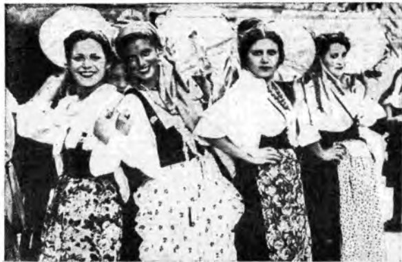
Bellezze e costumi tradizionali alla Sagra di Piedigrotta