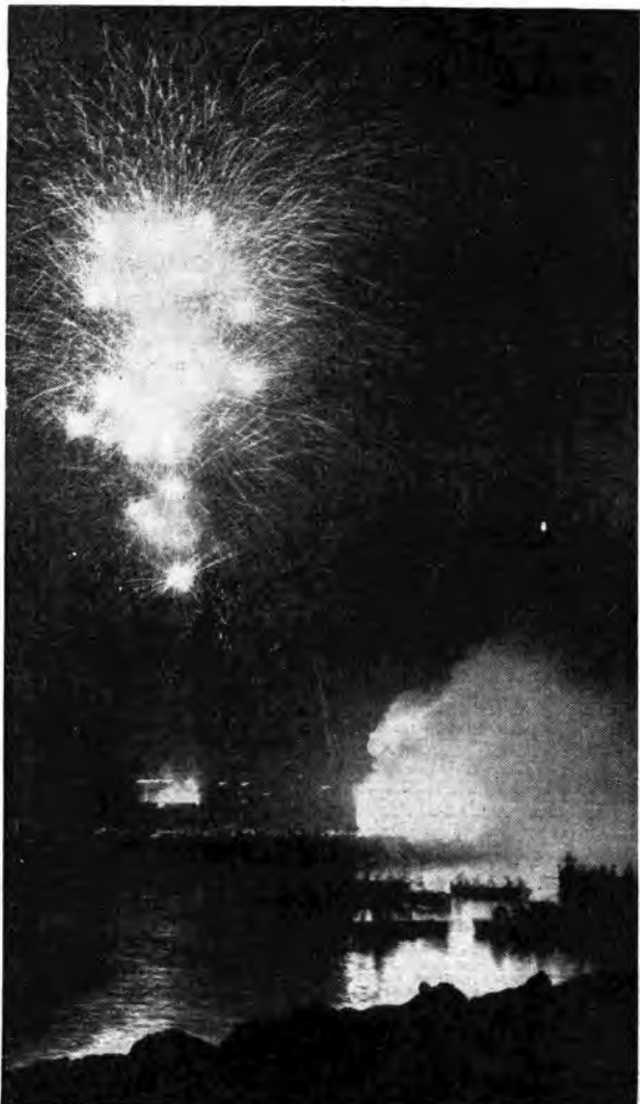
Fantastiche esplosioni di luce e di gioia popolare chiudono l'indimenticabile notte di Piedigrotta