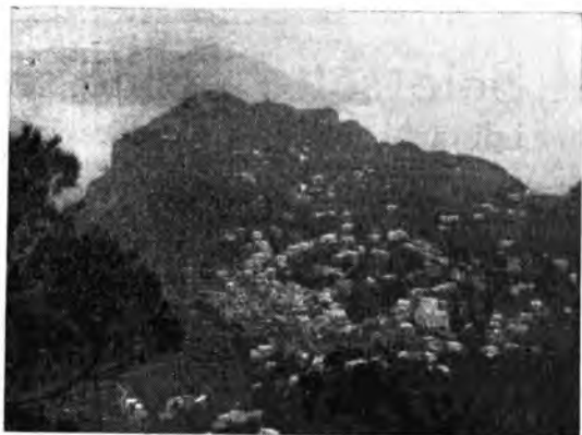
Tutta Capri vista dal Monte Solaro. Sullo sfondo, la penisola sorrentina.

La Radiodiffusion Française avrà una rappresentanza ben degna e importante. Quello del signor Porche, direttore generale, è un nome che non ha bisogno di essere illustrato, famoso ieri nel mondo delle lettere, oggi in quello della Radio. Saranno al fianco di questo autentico rappresentante della Parigi più valida il signor Paul Gilson, direttore dei Programmi della Radio Francese, il signor Manachem, direttore per le Relazioni con l'estero, e, se sarà libero dagli attuali lavori della Conferenza