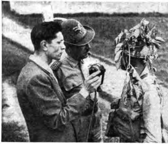
Fra il Mincio e l'Adda si sono svolte le grandi manovre di quest'anno. Il microfono della RAI non poteva mancare in queste manifestazioni nelle quali l'addestramento militare riceve il battesimo della finta guerra.

L'opera giocosa in un atto Il segreto di Susanna di Ermanno Wolf Ferrari fu rappresentata per la prima volta al « Teatro Reale » di Monaco di Baviera nel 1908. In questi quarant'anni ha percorso molta strada e il suo favore non si è mai spento in un tempo di repliche. Lavoro di piccole dimensioni, ma ricco di ispirazione e prodigo di semplice fastevolezza e di magistrale buon gusto, il segreto di Susanna al muove su di un argomento quanto mai lieve ed elementare, diramato su linee di come il sottile maestro di Tunisi che si sprigiona della sigaretta — innocente provocatrice del minuscolo dramma — che Susanna fuma di nascosto dal marito, tabacofobo dichiarato. Alla esile trama la musica di Wolf Ferrari presta tutti i suoi più delicati arabeschi e le sue sfumature più squisite.