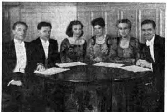
«The New English Singers» il celebre sestetto vocale Inglese che si presenta martedì per la prima volta ai microfoni della Radio Italiana. Com'è noto, è visibile anche dalla foto. Il sestetto canta seduto attorno ad un tavolo, continuando così la tradizione dei cantori esibizionisti, che usavano cantare i loro madrigali copo cena, rimanendo seduti ai loro posti.

linterà ad insistere, ed Edoardo perla di forzargli la pelle. Norton viene a sussurrargli, per di più che il capitale è ipotecato. L'americano pensa allora che meglio battere in ritirata, e così fa, provocando la ire di Tobia che lo sfida a duello. Impietosito, poi, dalle suppliche degli amanti, l'americano gira l'impegno ad Edoardo Milfort, cui si è intanto affezionato, e fa così due felici. Anche Tobia finisce con l'essere felice, perché il duello, che egli dopo avere provocato temeva maledettamente, si risolve in una buona pipata e perché Slook promette di nominare erede Edoardo se egli sposerà Fenny.