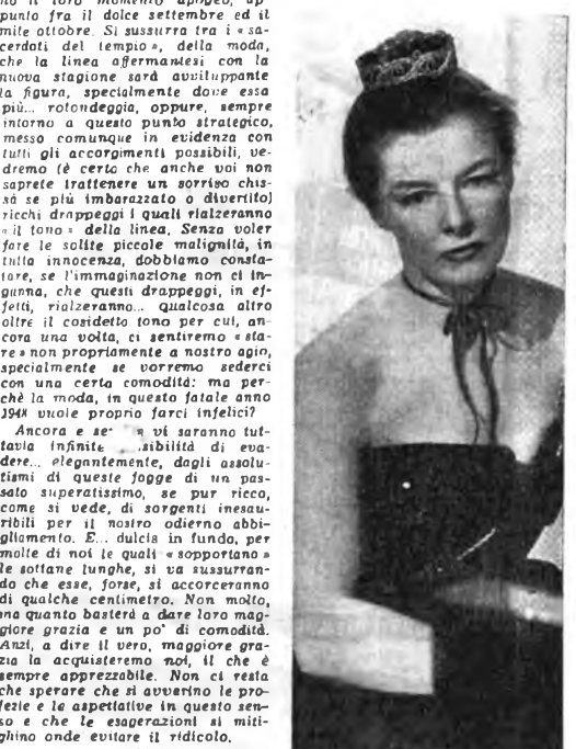
Trasmissioni per la donna: tutti i giorni (esclusa la domenica) alle ore 8,30 - Rete Rossa e Rete Azzurra. Katharine Hepburn, la cui biografia tomorrow sarà trasmessa domenica in «Pub» vere di stelle.