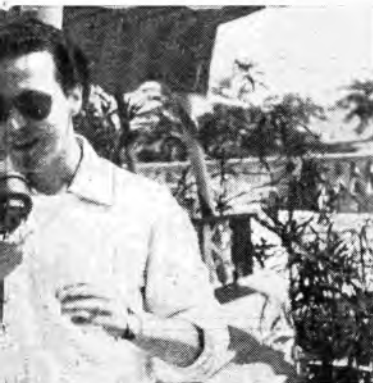
Silvio Vilhar, interprete del film « Guarany »