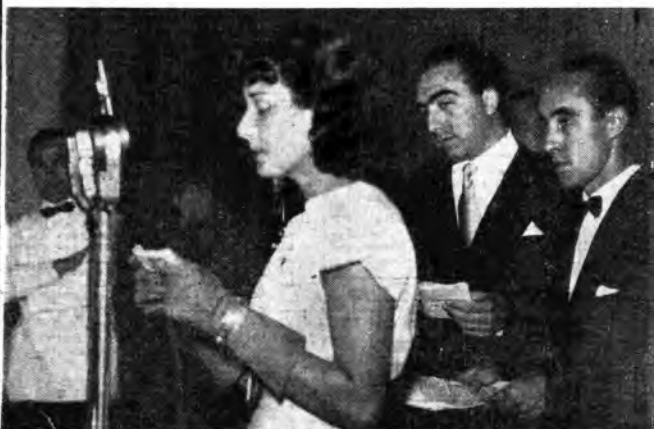
Una delle più graziose e ammirate attrici dello schermo italiano: Dina Sassoli