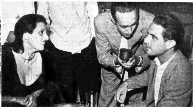
Confidenze di Anna Magnani e del regista Regato Castellani ai radioascoltatori di « Arcobaleno »