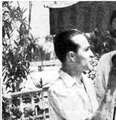
È al microfono l'attore portoghese Rato