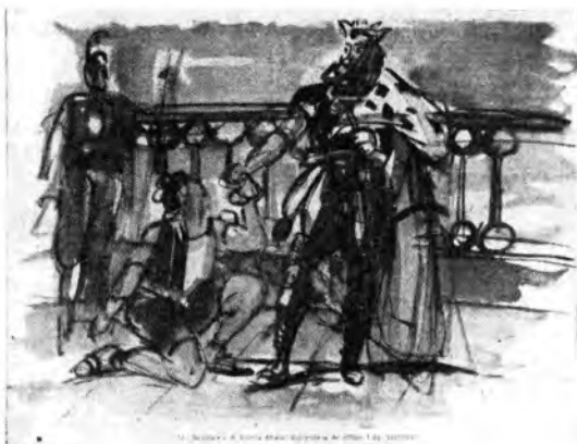
Una scena della « Sakuntala » di Franco Alfano nelle impressioni del pittore Luigi Spazapan.