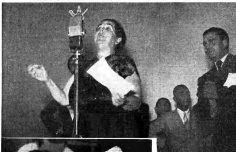
... E ora è al microfono Elsa Maxwell la «suocera di Hollywood»