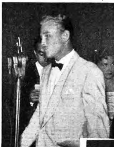
Il giovane attore francese Jacques Sernas che recentemente ha « girato » in Italia

Dopo le voci, eccovi ora i volti degli intervistati, colti dal nostro servizio fotografico in una altrettanto spontanea immediatezza di espressione.