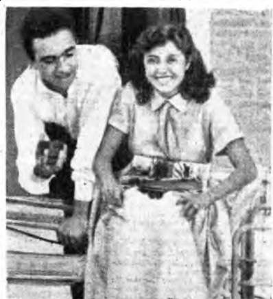
Lea Padovani sorride ad una domanda strettamente confidenziale