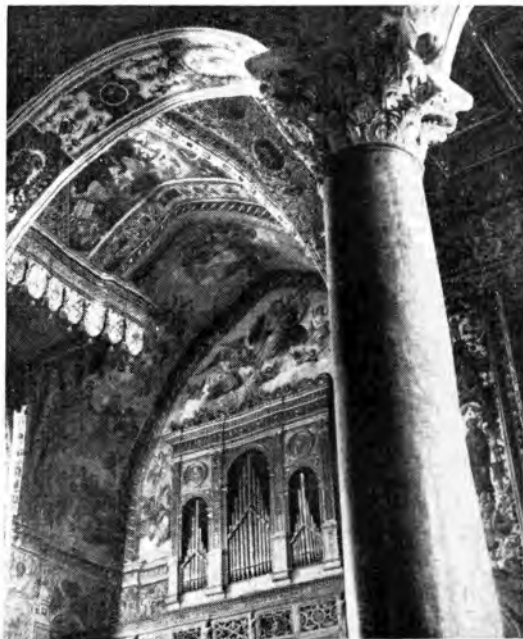
Scorcio dell'interno della chiesa di San Pietro in Perugia in cui verranno tenuti i concerti per soli, orchestra e coro della «Sagra Musicale dell'Umbria». (Domenica: «Requiem» di Paul Hindemith - Martedì: «Il giudizio universale» di Francesco Cavalli - Mercoledì: «La Passione secondo San Giovanni» di G. S. Bach.