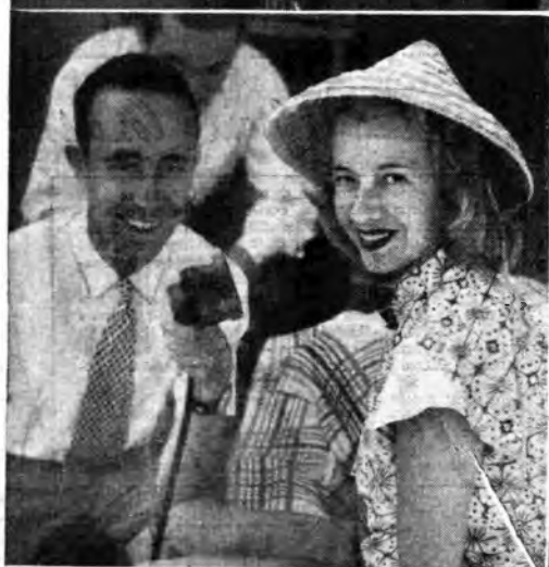
Intervista con la più celebre cantante del Metropolitan di New York; Lily Pons

Quando la partecipazione di un artista alla loro eccezionale serata rischiava di farsi problematica, eccoli pronti a scovarlo nell'atrio di un albergo o sulla spiaggia.