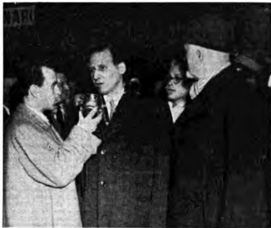
Il ministro degli esteri argentino Bramuglia accolto al suo arrivo a Roma dal conte Sforza e intervistato da Luca di Schiena per i microfoni della Rai.