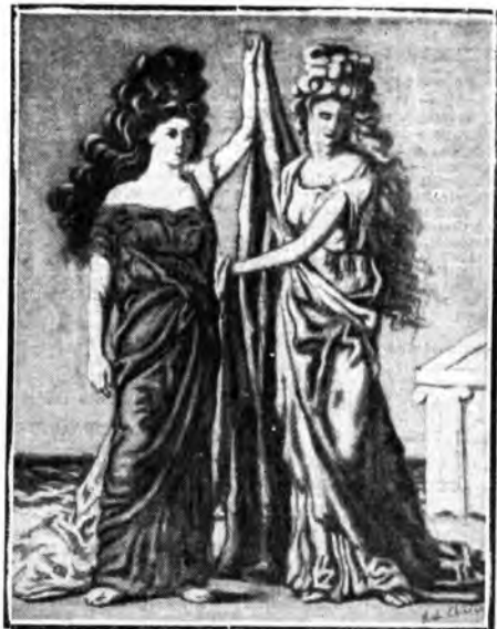
L'allegoria della Tragedia e della Comedienne in una raffigurazione pittorica di Giorgio De Chirico.

mesi or sono fece la prima comparsa nei programmi ed ha acquistato via via forme sempre più adeguate sia al tempo, limitatissimo purtroppo, sia alla importanza dei soggetti trattati; la conciliazione di tali due necessità indiscutibili è stata risolta in maniera che ha quasi sempre soddisfatto la nostra giovanile attenzione; e si può dire che la gioventù stessa si è soprattutto appassionata all'attività sincera di altri giovani che possono guidarla ai capolavori dell'eterna poe-