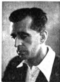
Il maestro Alfredo Simonetto dirige il concerto sinfonico-vocale di lunedì, ore 21,15 - Rete Azzurra.

se. Questo concerto è un capolavoro, ed è uno dei più frequentemente eseguiti. Coloro che stimano la musica di Mozart come limitata a quella sfera estetica definibile con i termini di grazia, di innocenza, di leggiadria, di spensieratezza, ascoltino queste pagine. Si troveranno in presenza di un Mozart meno convenzionale e più vero: sia nel malinconico e angoscioso battito dell' Allegro , sia nella divina poesia della Romanza , sia nella animazione ritmica del Rondo . Non senza significato è il ricordare che questo concerto fu particolarmente caro a Beethoven, il quale scrisse per esso alcune cadenze.