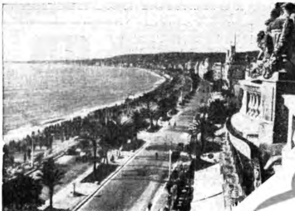
Una veduta de « La promenade des Anglais » di Nizza