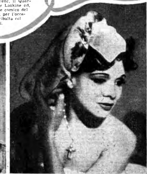
Un intero spettacolo sarà dedicato alle danze di Katherine Dunham