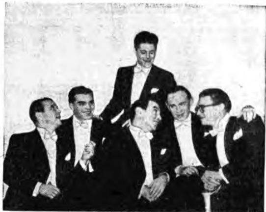
Il famoso complesso dei «Comedian Harmonists» inaugura mercoledì alle 20.32 dalla Rete Azzurra la serie delle trasmissioni de «I grandi interpreti della musica vocale da camera organizzate dalla RAI.

melodrammatica di quegli anni. È un errore e che sia un errore, questa spiegazione, ce lo conferma il fatto, che se tirannia melodrammatica vi fu negli ultimi decenni dell'800, questa non è paragonabile a quella che diede vita a migliaia e migliaia di spartiti e a decine di nuovi teatri, tra il 1860 e tutto il '700. Eppure tutti i più grandi interpreti di quell'epoca, la Rómmano, la Cuzzoni, la Giraud (amica e compagna d'arte di Antonio Vivaldi, l'Aguiari e così il Forinelli, il Restorini, il Carestini, il Cortonino, ecc., non trascurarono di coltivare l'attività concertistica, che allora era vera e propria attività da camera. Infatti la produzione delle arte da camera e delle cantate da camera di quegli anni è