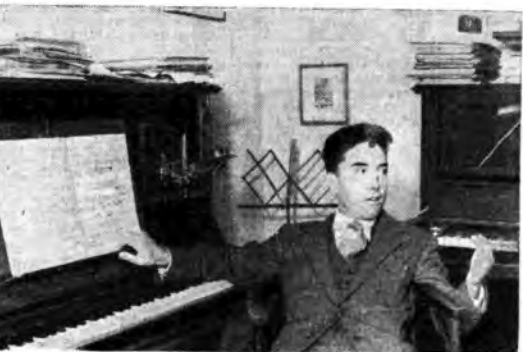
Per il ciclo «Celebri compositori d'oggi» viene trasmesso questa settimana un programma di musiche vocali e strumentali da camera di Luigi Dallapiccola.