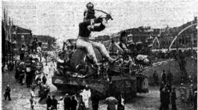
Nizza: nella gioiosa città nel Carnevale sfilano i tradizionali carri allegorici e grotteschi