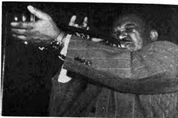
Da sinistra: il celebre comico Grouck, che prenderà parte al «Gala des étoiles de France»; il trio vocale svizzero «Geschwister Schmid» e la famosa tromba americana Rex Stewart al sabbatino invece al «Gala des étoiles du monde»