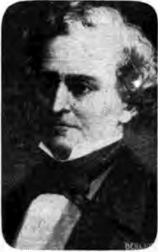
Tale concerto è completamente dedicato all'esecuzione di musiche poco note di Ettore Berlioz.