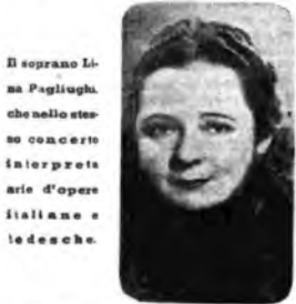
Il soprano Lisa Pagliughi, che nello stesso concerto interpreterà arie d'opere italiane e tedesche.