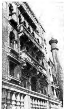
Uno scorcio della facciata di Ca' Giustinian a Venezia.

Ascoltate dunque un grande musicista uomo vittorioso dalla prova del tempo.