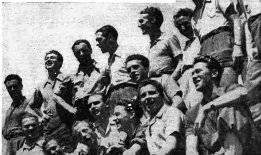
Ma non mancano, nel vasto panorama di canzoni alla Radio, i canti regionali. Ecco il coro della Società Alpinistica Trentina che non di rado porta ai microfoni i canti della montagna.