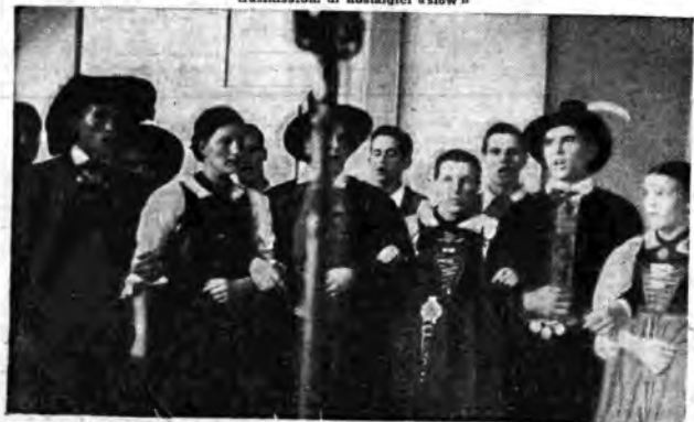
Questo pittoresco e grazioso coro di valligiani altoatesini, dai festosi e tradizionali costumi, partecipa frequentemente alle trasmissioni bilingue di Radio Bolzano.