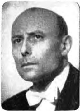
Per la Stagione Sinfonica della Radio Italiana dirigeno - venerdì della Rete Azzurra - Vittorio Gul (in alto), e - mercoledì della Rete Rossa - Gaston Poulet (in basso).