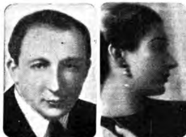
A. concerto sinfonico-vocale di lunedì, che sarà diretto da Francesco Molinari Pradelli (il primo a sinistra), partecipano il soprano Maria Callas e il tenore Mario Filippeschi.

* Con il Teatro dell'Opera di Roma la Radio si collega (sabato, ore 20,32, Rete Azzurra) per la trasmissione del Simon Boccanegra di Verdi, opera già nota ai nostri ascoltatori; per essere stata eseguita qualche mese fa nella Stagione Lirica Autunnale della RAI. Simon Boccanegra non appare di frequente sui cartelloni dei teatri come altre opere di Verdi, certamente più popolari e rinomate. La prima rappresentazione,