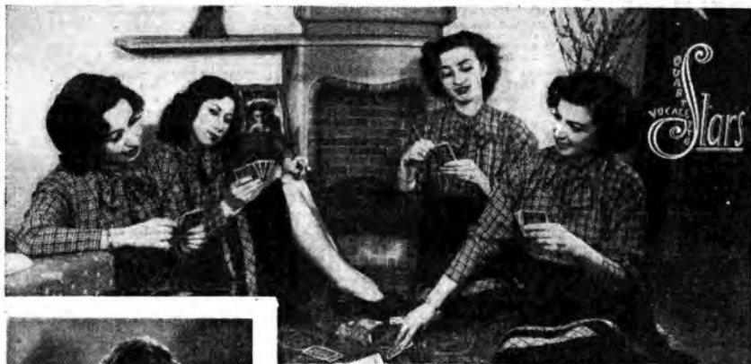
Molte canzoni trovano un suggestivo sfondo sonoro nelle armonie del Quartetto Stars