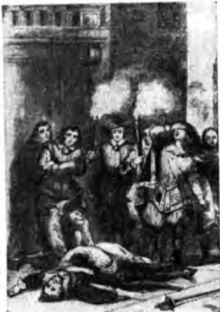
Una scena del « Don Giovanni » in una stampa del 1844.

F igura tipicamente settecentesca, agglomerato di passioni basse ed elette, di intelligenza grezza e di intuizioni raffinate, di spirito di avventura e di monotoni luoghi comuni societari, Lorenzo Da Ponte è oggi ancora vivo, vivissimo, alla luce della critica: i suoi muscoli reagiscono a certe analisi anatomiche che certuni specialisti della cosiddetta « patologia artistica » vorrebbero praticargli, per dimostrare che la sua grandezza fu una grandezza di riflesso, passiva, dunque, parassitaria. Nulla, insomma, sarebbe stato Da Ponte senza Wolfgang Amedeo Mozart.