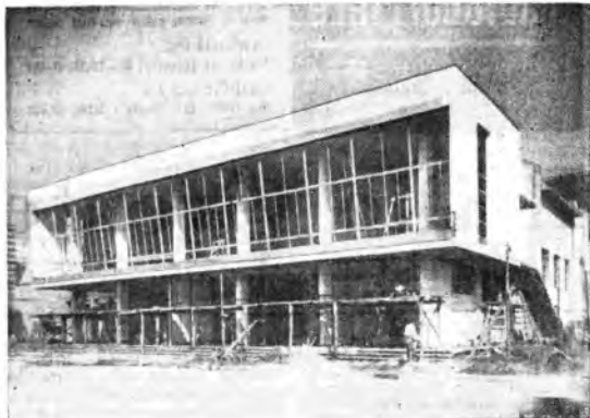
Si allestisce il padiglione che verrà adibito alla Mostra delle attività della RAI e ai suoi speciali spettacoli.