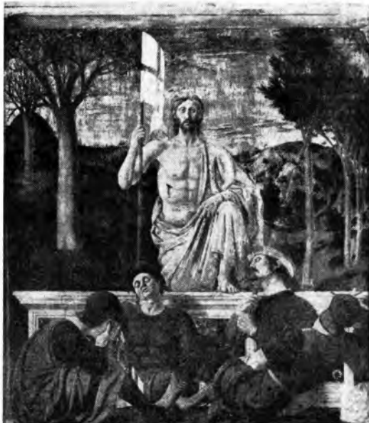
La Resurrezione di Nostro Signore nel dipinto di Piero della Francesca che si trova nella Chiesa di Borgo S. Sepolcro

Da spettatore armato di uno scetticismo che, nel caso presente, è anche obbiettività professionale, il radiocronista partecipa agli avvenimenti che registra con una emozione sempre più sincera ed appassionata; finché, attraverso una serie di testimonianze piccole e grandi, confortato dalla tradizione popolare, illuminato definitivamente dalla Resurrezione, ogni suo dubbio cade, ed egli stesso porta ai nostri giorni; la sua testimonianza di fede, la sua certezza sull'eterna validità del dramma, sulla viva presenza del Cristo che opera fra noi con la stessa attualità di ieri, di sempre.