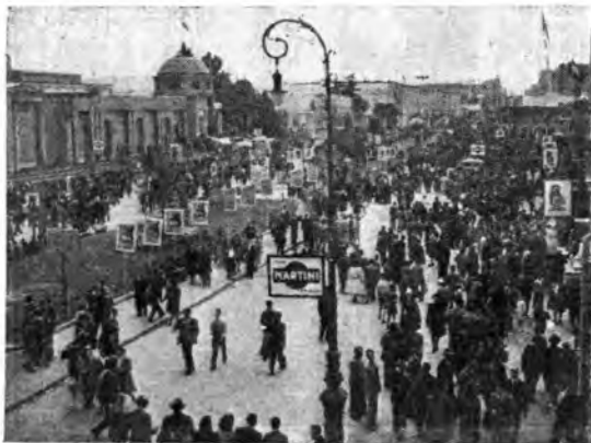
La Fiera di Milano riapre i battenti alla strabocchevole folla dei suoi visitatori.

La fisionomia architettonica della Fiera ha subito notevoli cambiamenti per la costruzione di numerosi