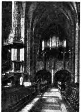
Interno della chiesa di San Tomaso a Lipsia con l'organo usato da Bach.

dizioni musicali si fissarono sopra un unico, ma altissimo argomento, la Passione di Cristo, secondo la narrazione di uno dei quattro Evangelisti. In origine le « passioni », secondo l'uso prevalente del tempo, furono interamente corali: anche le parole attribuite a un singolo personaggio venivano intonate da un coro a cappella. Ma lungo il '600 la diffusione del nuovo stile recitativo inaugurato dalle opere teatrali italiane portò a una distribuzione più realistica delle parti, e le « passioni », come gli oratori, constarono di pezzi di canto solistici sia in stile recitativo che di vere e proprie arie, e di pezzi corali. La dove l'azione richiedesse l'intervento di masse. L'adozione dei modi italiani di canto, recitativo e arie, riuscì felicemente al grande Heinrich Schütz che visse un secolo prima di Bach, aveva musicato le Passioni secondo il testo dei quattro Evangelisti.