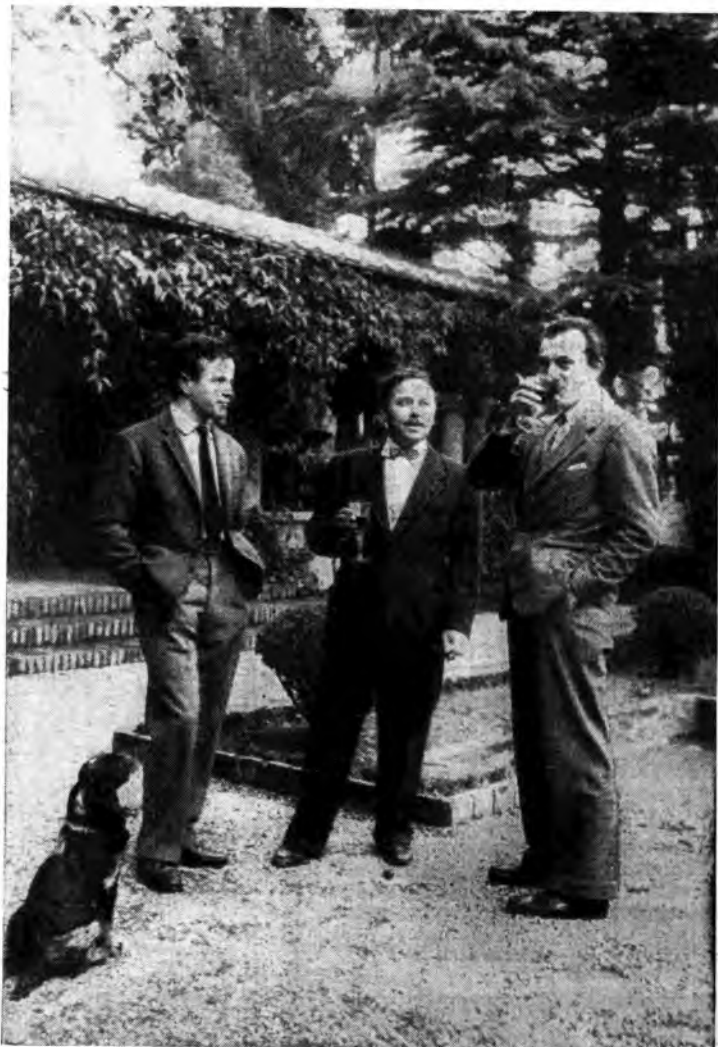
ROMA - IL COMMEDIografo AMERICANO TENNESSEE WILLIAMS (AL CENTRO) NEL GIARDINO DELLA VILLA DI LUCHINO VISCONTI (A DESTRA)