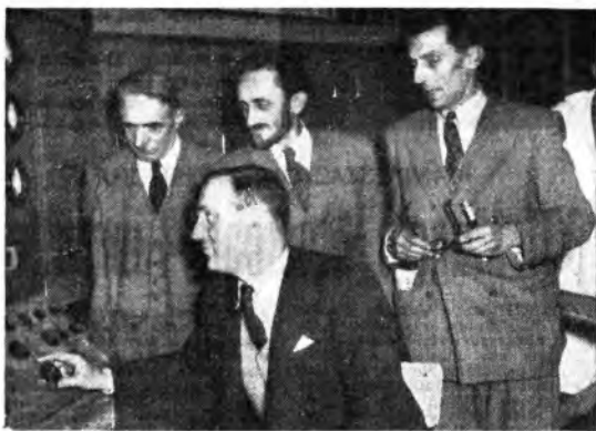
Intervista radiofonica con i realizzatori della prima pila atomica francese. Il primo a destra è il fisico Joliot-Curie.

Ho associato il concetto di Loran a quello di navigazione costiera con riferimenti a terra ed insisto su questo punto per meglio chiarire il principio funzionale di questo apparecchio. Infatti, se noi in base al rilievo di due punti di riferimento, per esempio la torre di un faro e il campanile di una chiesa, possiamo determinare sulla carta l'esatta posizione della nave, con altrettanta facilità e precisione potremmo determinarla in base alla direzione di provenienza di onde emesse da due stazioni radio ed in base alla distanza che corre fra di loro e tra queste e la nave. Nelle ore diurne il raggio di funzionamento del Loran si aggira sulle 800 miglia marine ed arriva a superare le 1000 miglia di notte. In quanto alla precisione del rilevamento Loran dico che a circa 1000 miglia dalla costa il punto si può rilevare con un errore di uno o due miglia al massimo, che più vicini si potrebbe localizzare esattamente la prora o la poppa di un grosso vapore se condizioni di mare e di vento lo permettessero. Il punto nave può essere fatto in due minuti circa e l'istruzione del personale è insignificante perché fare un rilevamento Loran presenta le