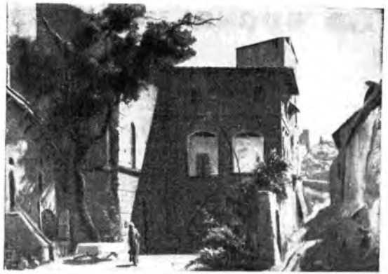
«Vanna Lupa» di Pizzetti - Scena dell'atto primo: il cortile della Casa dei Velluti, alla Costa S. Giorgio a Firenze. (Bozzetto di P. Annunziati).

terviene; no, è stata lei, la Lupa, a compiere il negozio. Salvato ha il figlio, ma la sete della vendetta ghibellina in lei non si placa; per tanto non può comprendere il dramma di Vieri, che considera la sua liberazione un tradimento.