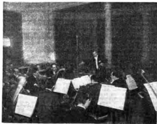
L'Orchestra da camera di Venezia diretta da Angelo Eshkikian durante uno dei concerti de «L'ora di Vivaldi».

Ed è proprio dopo questa «svolta» che ha inizio una mirabile fioritura di composizioni pianistiche di rara originalità, cui appartengono, oltre il Diario indiano (1915) le sei singolari Sonatine , alcune delle quali provviste di titoli latini, come Sonatina ad usum infantis (1916), Sonatina in dien Nativitatis Christi (1917), Sonatina brevis in signo Johannis Sebastiani Magni (1919) e infine la Sonatina super Carmen (1921). L'ultima di queste, e quella in dien Nativitatis , sono forse le più prossime ad acquistare una specie di popolarità, sebbene pochi pianisti amino cimentarsi con le difficoltà eccezionali e d'altra parte non apprezzabili di queste musiche. Ma la Sonatina brevis , nel segno del grande Giovanni Sebastiano, è quella che rivela le ragioni storiche della evoluzione stilistica impressa da Busoni alla musica moderna, sciogliendo un voto di omaggio a Bach. E la Sonatina seconda (1912), senza titolo, sebbene sia una delle più difficili e astruse, col suo occasionale accostamento ai modi schubbergiani di allora, è probabilmente la più importante e quella più ricca di autentica invenzione musicale. Essa è come uno studio per l'opera Dottor Faust , che Busoni scriverà molti anni dopo e di cui contiene già alcuni temi, ma del cui spirito, anelante e veramente «fou-siano», è soprattutto pervasa.