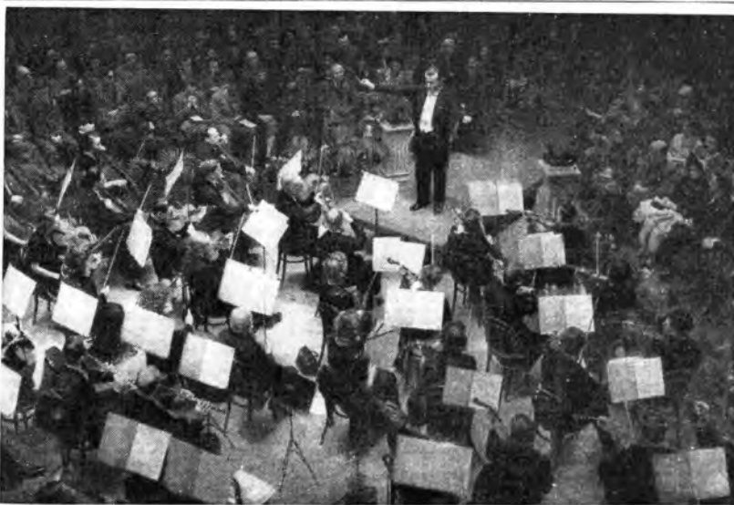
Musica italiana in Inghilterra diretta da Fernando Previtali

Il maestro Fernando Previtali, direttore dell'Orchestra sinfonica di Roma della Radio Italiana, è ritornato in questi giorni da un giro artistico in Inghilterra, dove ha diretto sette concerti con l'Orchestra Hallé di Manchester (sopra ritratta) e due, particolarmente dedicati alla musica sinfonica italiana, per la B.B.C. di Londra. Vivissimo è stato il successo e unanime l'interesse per la musica italiana. Il maestro Previtali è stato riconfermato per la stagione prossima a Londra e in altre città dell'Inghilterra.