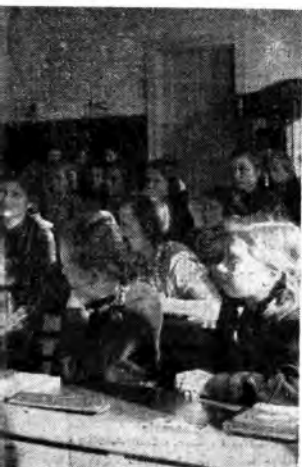
■ (A sinistra): In alcune scuole tedesche fra le materie di studio sono comprese anche le prime nozioni di radiotecnica.