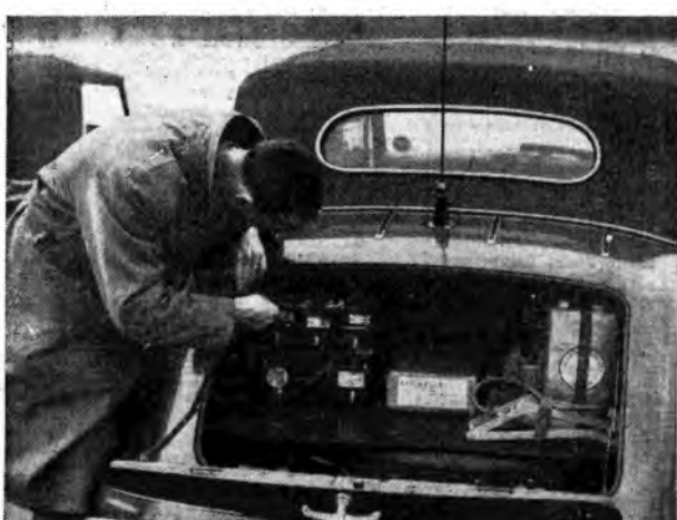
■ (A destra): Questo signore ha equipaggiato la sua automobile con un apparecchio radiotelevisivo - trasmettente in miniatura. Davvero potrà dire che non rimarrà solo, almeno per un raggio di 8 miglia.