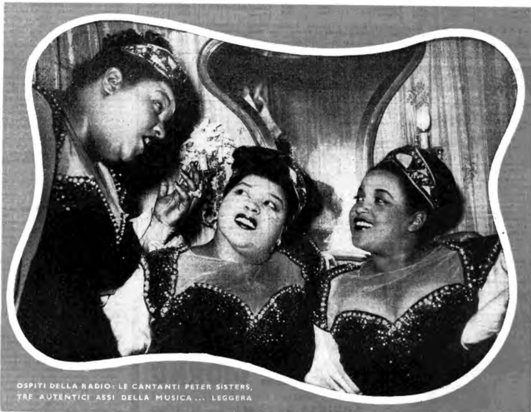
OSPITI DELLA RADIO: LE CANTANTI PETER SISTERS, TRE AUTENTICI ASSI DELLA MUSICA ... LEGGERA