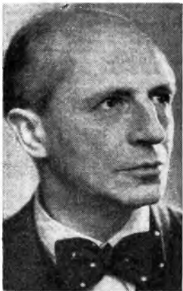
Carl Schuricht, che dirige il Concerto sinfonico di venerdì alle ore 21 per la Rete Azzurra.

superato il genere sinfonico e fatto ingresso in quella forma d'arte completa e universale che è il dramma.