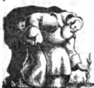
IL FRATE DELLA SALUTE