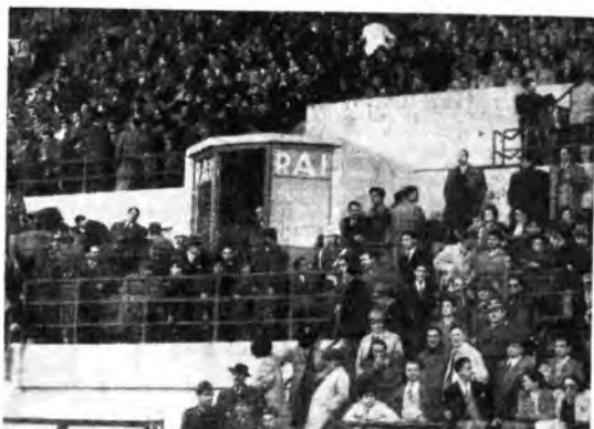
La Radio Italiana ha ormai dotato i maggiori campi sportivi italiani di speciali attrezzature tecniche per la trasmissione delle radioracche. Ecco la cabina allestita nello Stadio sportivo di Bari.