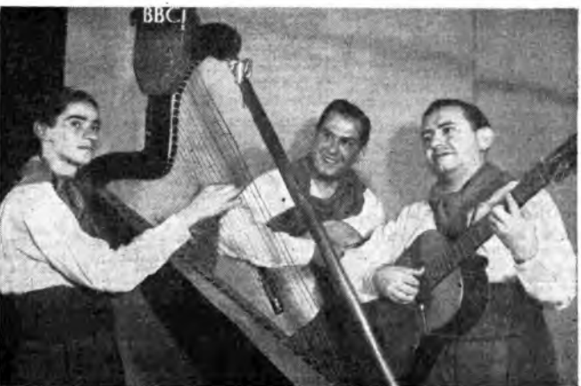
...bastano ad esprimere il fascino dei ritmi sudamericani nell'esecuzione