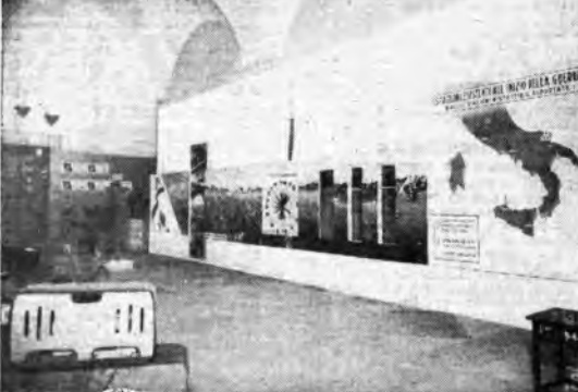
Nel saloni del Consiglio Comunale di Foggia, alla presenza delle maggiori autorità cittadine, è stata inaugurata recentemente la I Mostra della Radio. Alla Mostra, sorta per iniziativa dei commercianti locali di apparecchi radio, ha partecipato la Radio Italiana con alcuni pannelli illustranti sinteticamente le sue attività e i risultati raggiunti nel campo della radiodiffusione.