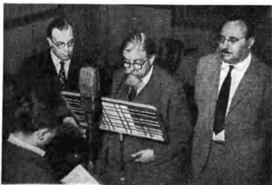
Milano. In primo piano, Gustavo Colonnetti, presidente del Consiglio nazionale delle Ricerche (al centro), mentre è intervistato da un nostro radiocronista sui risultati del concorso promosso dalla Ripresa Edilizia.