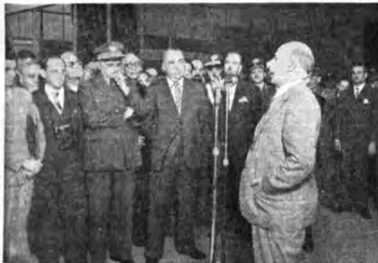
Torino - Il Ministro Tupini inaugura la « Mostra della Casa Moderna » nel Palazzo delle Esposizioni al Valentino.