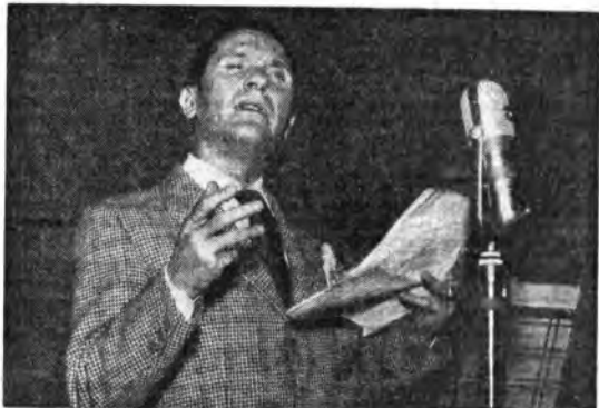
Un assiduo e simpatico ospite dei nostri microfoni: Paolo Stoppa

Il racconto, fra l'umoristico e il patetico, procede serrato fino alla ineluttabile conclusione finale: le sottili analisi psicologiche e la ricreazione fantastica si fondono armonicamente, determinando nell'ascoltatore una suggestione profonda e duratura.