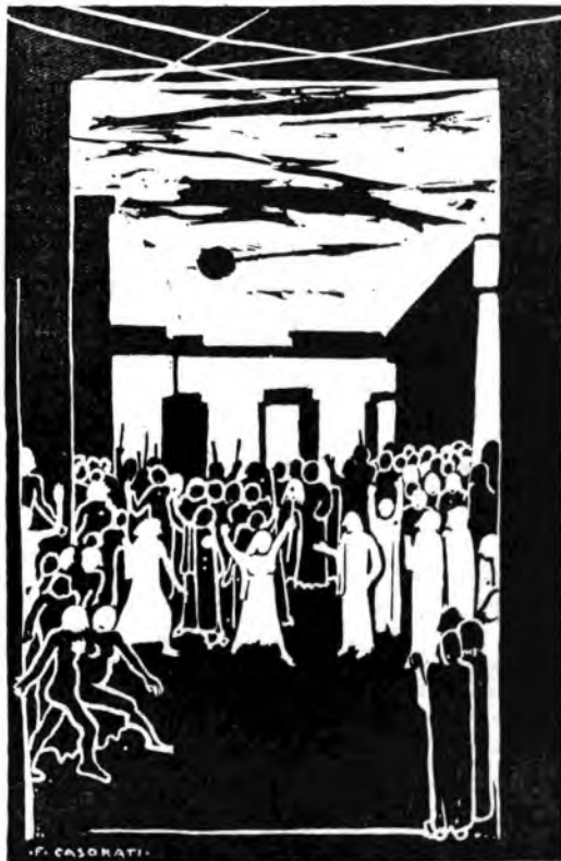
«Le Baccanti» di Giorgio Federico Ghedini - Atto III (disegno di Felice Casorati).

La libera riduzione di Tullio Pinelli dell'omonima tragedia di Euripide ha tagliato il testo poetico in un prologo e tre atti, il secondo dei quali suddiviso in due quadri. Nel prologo il giovane iddio Dioniso giunge dall'Asia misteriosa, col suo corteggio, in Tebe governata dalle serene leggi elleniche, e qui annunzia il suo culto di ebbrezza cui nessuno potrà opporsi. Nel primo atto, la regina Agave è conquistata all'esaltazione bacchica e sale al Citerone con le Menadi. Il figlio di lei, l'animoso Penteo che governa su Tebe, invano dissuaso dai