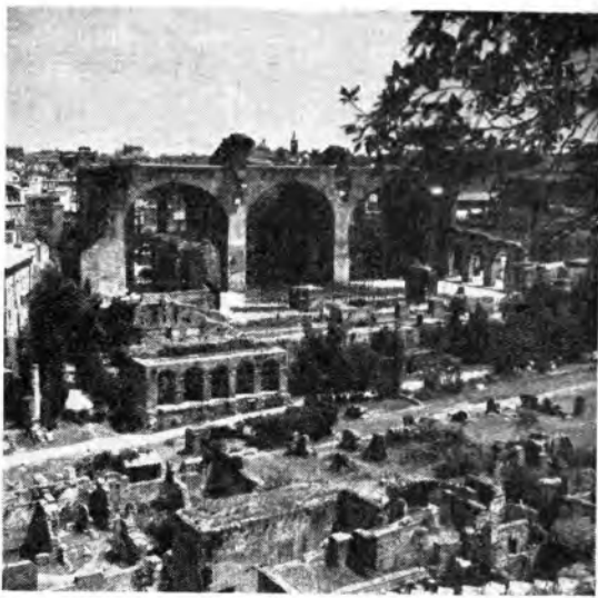
Una bella inquadratura della Basilica di Massenzio in Roma ove si svolgono i tradizionali concerti estivi dell'Accademia Nazionale di Santa Cecilia.