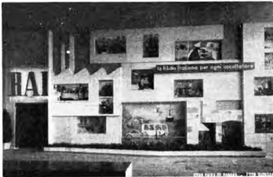
Il padiglione della Radio Italiana alla Fiera di Padova.

Nel corso di questo puntata infatti vedremo il buffo animale scotrazzare per tutto il regno di Curlandia, combinando ogni sorta