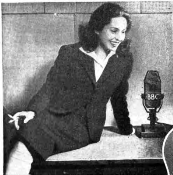
(In alto) L'attrice Lea Padovani, durante una recente visita a Londra, ha concesso un'intervista dai microfoni della B. B. C.