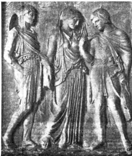
Orfeo ed Euridice in un attorellio dell'antica Grecia.

Riccardo Strauss volle comporre con Il cavaliere della rosa un'opera allo Mozart. Lo scrisse a un amico: « Das nächstbestmögliche schreibe ich eine Mozartoper! ». I ritmi di valzer viennesi del Cavaliere hanno lo stesso spirito dei minuetti de La nozze di Figaro . Spirito perfettamente consono al tempo e all'ambiente di quella Vienna borghese