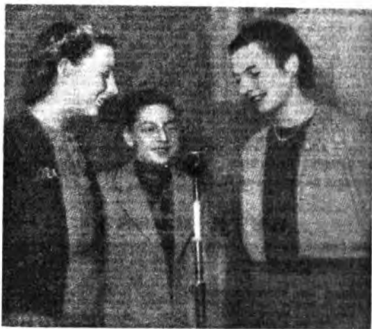
Un trio di giovani attori di Radio Monte Ceneri durante una trasmissione scolastica.

Alle trasmissioni, oltre agli attori professionisti della RSI e agli «juviores», partecipano di volta in volta ragazzi delle scuole, isolati o a