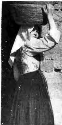
Una graziosa popolana sarda nel suo tradizionale e pittoresco costume.

metà del secolo scorso per raggiungere i frammenti della poesia popolare italiana. Ma allora si credette che i segreti folcloristici fossero tutti nascosti nei versi e nelle strofe: venne così completamente trascurata la parte musicale, date anche le giustificare difficoltà di riprendere e riprodurre i suoni. Fu soltanto nel 1910, o giù di lì, che i nostri musicisti cominciarono a comprendere l'effettiva importanza della melodia legata al verso, e fu soltanto quando il discorso poté essere realizzato con facilità che tale musica venne fissata e riprodotta attraverso le macchine parlanti. In quaranta anni è stato fatto, in questo campo, un lavoro enorme, al quale hanno partecipato, con eguale passione, musicisti, letterati e tecnici del suono. Fu da allora che si cominciò a innuire che ascoltare le musiche tradizionali senza orecchi e senza abbellimenti, significava collegarsi spiritualmente con la storia di un popolo, con le sue tradizioni, con i suoi costumi, in una parola con la sua vita.