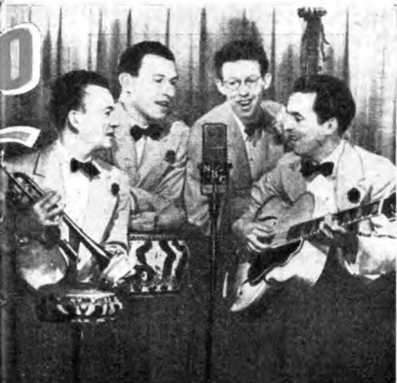
(In alto) Fred Waring e la sua orchestra di danza sono disputatissimi dai microfoni delle radio americane.