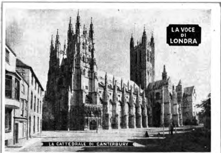
LA VOCE DI LONDRA - LUNEDÌ, ORE 17.30 - RETE AZZURRA

Sole della Chiesa Metropolitana inglese, la Cattedrale di Canterbury è uno dei più insigni monumenti artistici e storici dell'Inghilterra.