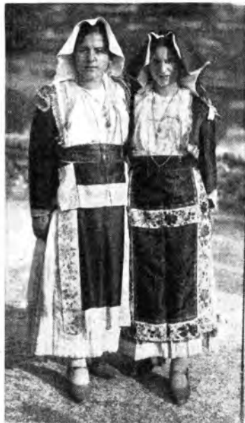
Ragazze di Benevento nelle pomesse e ieratiche vesti di Valle Agricola.