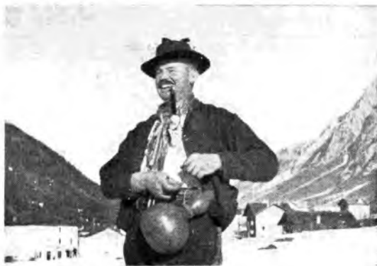
Alpignano trentino col caratteristico cappelluccio alla tirolese.

All'estero è stato già fatto, in piccola parte e soltanto localmente, ciò che fa la Rai in Italia. Sì, è vero, da noi tutto ciò era stato tra-