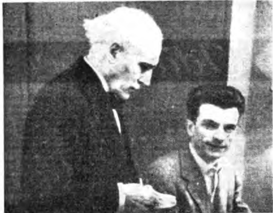
Arturo Toscanini con Guido Cantelli, il giovane e valoroso direttore d'orchestra, verso cui il grande Maestro è stato prodigo di preziosi consigli sull'arte direttoriale.