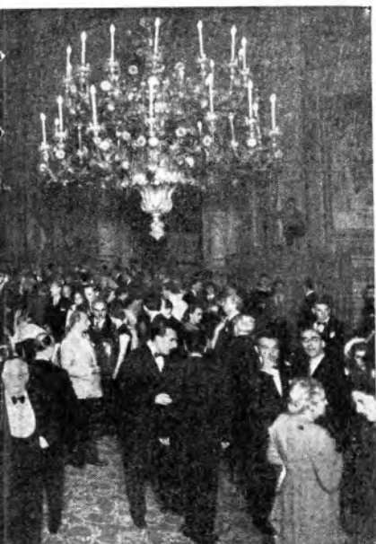
... alla presenza di numerose personalità del mondo del Premio Italia - In basso un particolare della sala.