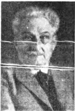
Il compositore cecoslovacco Leo Janacek