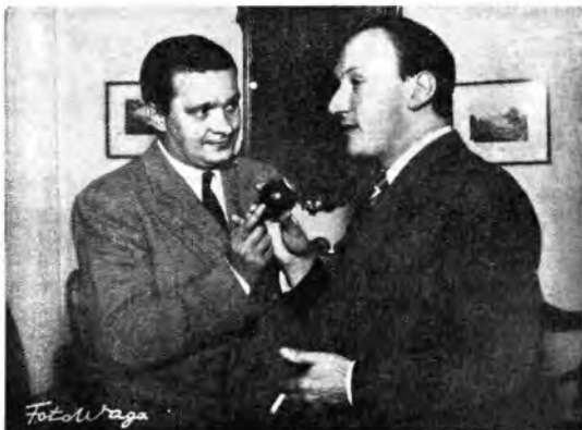
Wladimir Porché, direttore generale della Radiodiffusion Française (a destra).

Dichiarazioni che, se riempiono di legittima soddisfazione quanti della RAI — dirigenti e collaboratori — si sono adoperati per la buona riuscita del Primo Premio Italia, costituiscono pure l'auspicio di quanti, pur vivendo lontano dalle organizzazioni radiofoniche, sanno valutare ugualmente il peso che le radiotrasmissioni vanno acquistando, di giorno in giorno, sempre più prepotente e consistente nel campo dell'arte, quale espressione di attività sociale, quindi di viva e urgente attualità.