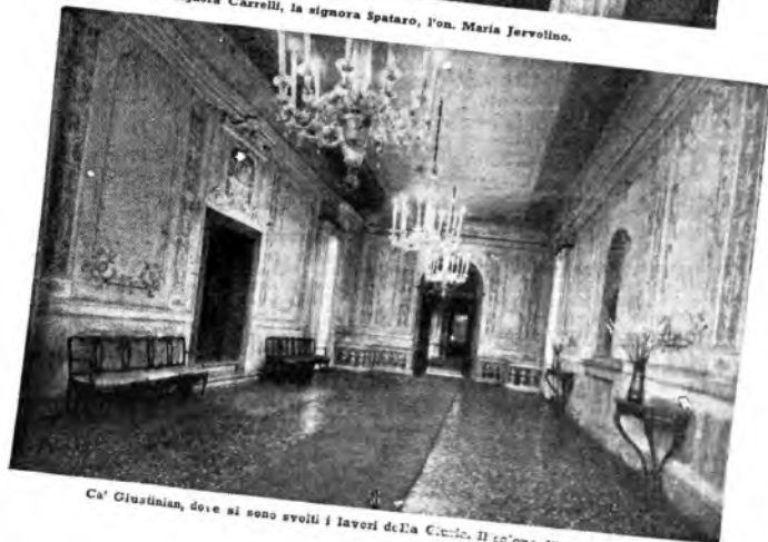
Ca' Giustinian, dove si sono svolti i lavori de La Città. Il salotto d'ingresso.