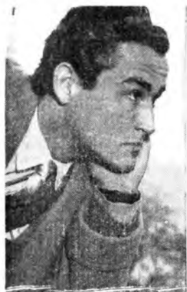
Vittorio Gassman, che ha inaugurato i «Notturni Teatrali» interpretando il personaggio di Oreste attraverso Eschilo, Alfieri, O'Neill e Sartre.

Tacciamo così clamorosi e non indaghiamo i tipi minuti, che sono gli stessi che ritroviamo nelle «Atellane» e nelle maschere nostrane. Dedichiamoci a Trageo, oggi. Lo incontriamo nella Pace, alla ricerca della medesima, ma più fantasiosa ed imperi luoghi. A quel tempo l'ambizione di Alcibiade si va congiungendo una nuova guerra fra Sparta ed Atene. Insores Aristofane e mediante questa opera, fece sua la ribellione di tutti contro la nuova provocazione. E tutto questo rappresentato con generosità umanità, con lucidità di parossismi. Nella Pace gli accenti cruenti si avvicendano a visioni didattiche. Tutto il servizio però dell'idea dominante nell'autore, l'umano sgomento davanti alla guerra, la feruorosa ricerca della pace.