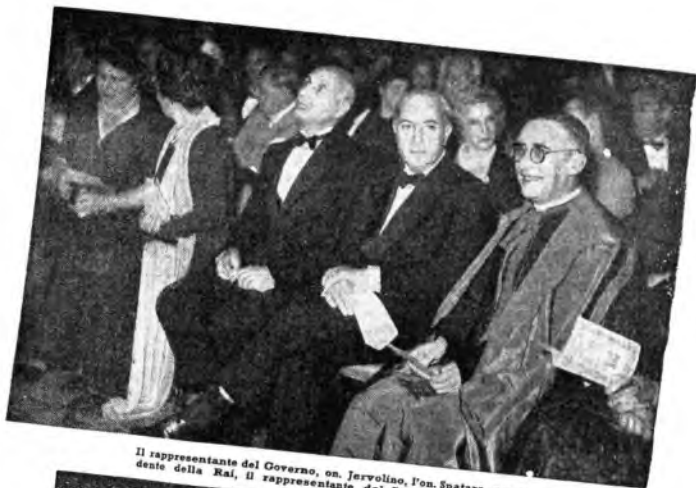
Il rappresentante del Governo, on. Jervolino, l'on. Spataro, presidente della Rai, il rappresentante del Patriarca di Venezia.