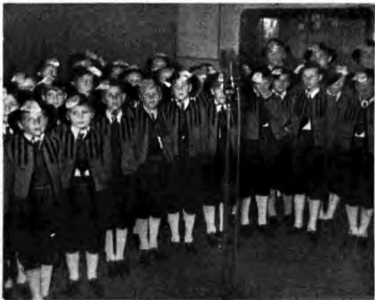
I piccoli cantori di Wilten (Innsbruck) ai microfoni di Radio Bolzano.

E' quanto doverosamente facciamo, ricordando in proposito che il baritone Giulio Fregosi ebbe a sostenere lo stesso ruolo anche nell'edizione radiofonica dell'opera del maestro Robbiani da noi curata e trasmessa il 20 luglio 1955.