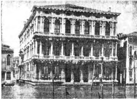
Il superbo palazzo di Ca' Rezzonico sul Canal Grande.

Il Governo italiano è fiero — egli dice — che, solo a pochi anni dalle distruzioni che hanno dilaniato il nostro Paese, un clima di costruttività e di pace fecunda nel lavoro e nella solidarietà sociale crei, anche per questa manifestazione internazionale, l'ambiente storico e ne-