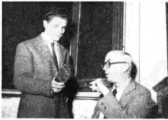
Milano - Il romanziere americano J. Dos Passos, di passaggio a Milano, viene intervistato da un nostro radiocronista.

Quattro sono i momenti che si possono distinguere nella sinfonia: il primo, dolcemente e nobilmente appassionato (il celebre quintetto dei violoncelli); un accento misterioso e sinistro alla tempesta; l'episodio pastorale con la serena melodia affidata al corno inglese; e infine, il momento guerresco che si innesta al precedente con irresistibile effetto (la famosissima fanfara annunciata da uno squallare di trombe e sviluppata con quei magici effetti di crescendo e di contrasti di cui Rossini fu maestro).