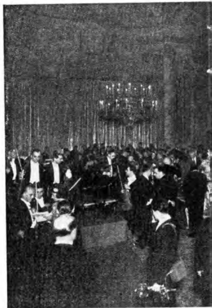
Nei fastosi saloni di Ca' Rezzonico ha avuto luogo il concerto politico e culturale, la cerimonia dell'assegnazione