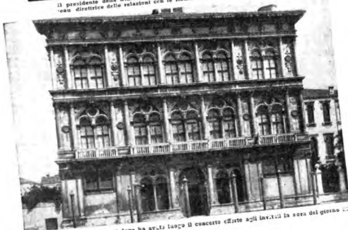
Il palazzo Venier-Framin - Calergi dove ha avuto luogo il concerto offerto agli invitati la sera del giorno 22