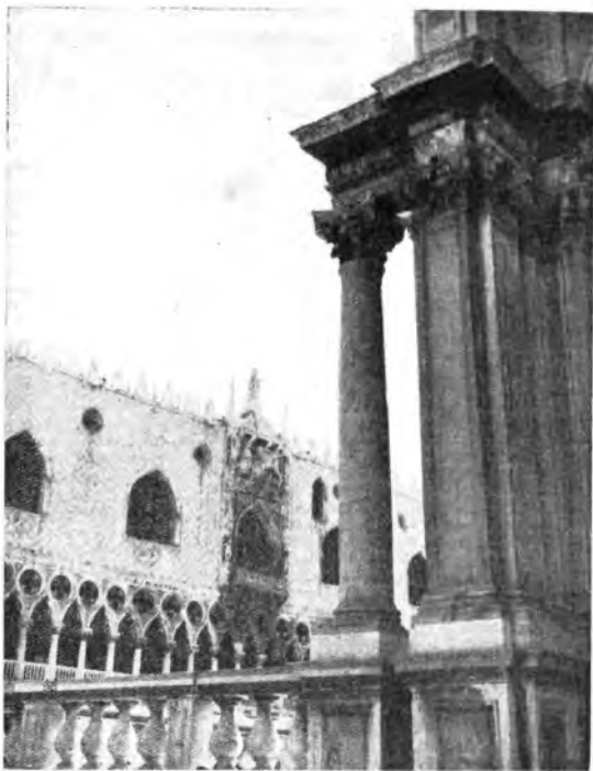
L'architettura di Venezia è da secoli l'affermazione stessa dell'arte.

« Siamo estremamente felici, non solamente per gli autori, i cui meriti sono stati riconosciuti, ma anche per il nostro "club sperimenta-