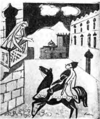
Una delle scene farsesche di «L'heure espagnole» di Maurice Ravel, e, a destra, la scena della liberazione della sposa da «El retablo de Maese Pedro» di Manuel De Falla (Disegni di Paulucci)