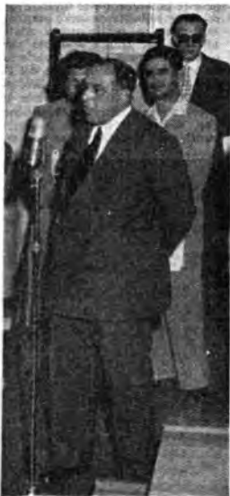
Il Sottosegretario alla Difesa on. Meda rivolge il suo saluto alle Forze Armate.

Questo nuovo tipo di programma non contempla la trasmissione di canzoni con dediche. Tuttavia, nei limiti del possibile, saranno tenuti presenti le eventuali richieste e i desideri dei militari. Essi potranno inviare dette richieste alle RAI - Trasmissioni per le Forze Armate - Via Botteghe Oscure 54, Roma.