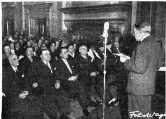
Con una cordia protezione del musicologo Fausto Torrefranca, alla presenza dell'ambasciatore di Polonia, Adam Ostrowsky, e di personalità dell'arte, del pensiero e della diplomazia, si è svolta recentemente in Roma all'Accademia dei Lincei l'inaugurazione dell'Istituto Internazionale Federico Chopin.