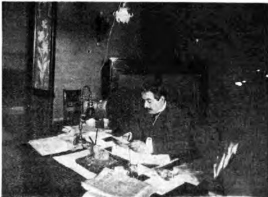
Puccini al tavolo di lavoro nel suo studio di via Giuseppe Verdi in Milano.

Due momenti ricordo di lui, uno di galezza studentesca, uno