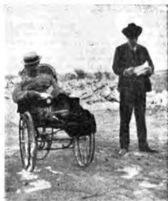
Un raro documento fotografico: Puccini è costretto a muoversi in carrozzella per l'incidente automobilistico del 1904 che gli causò la frattura della tibia destra. Sul retro della foto sta scritto di pugno del Maestro: «Son dolori!...»

l'alto; e così, caccio poco più di zero. Sono solo come Tiburzi, ho una banda di uomini che mangia a crepapelle, poi cani, civette, ciuchit e io in mezzo a queste creature, uomini e bestie e bestie. Sono come il re Travicello perché fanno tutti il loro comodo e alla sera, non stanchi certo, io, per compiere la fratellanza, gioco a briscola con loro e caccio i cani e adocchio le civette che mi salutano coll'alzare e abbassare la testa. In mezzo a tutto questo, qualche melodia cinese vestita di mia esce dal pianoforte. Ma se arrivasse qui una prima donna? Le donanderei come si chiama — se dice Turandot entri, — in sala, vicina al mio tavolo, al piano. Se avesse altro nome? Chi sa. Io vorrei la principessa». E andò a finire che anche la Tagliata lo deluse: si che la cedette altrui, subito arroveliandosi per averla venduta.