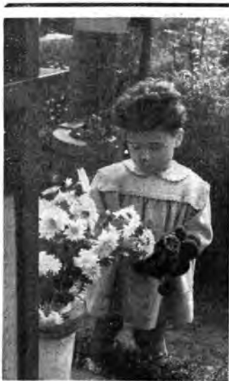
2 NOVEMBRE: preziosi omaggi di fiori ai nostri cari defunti.