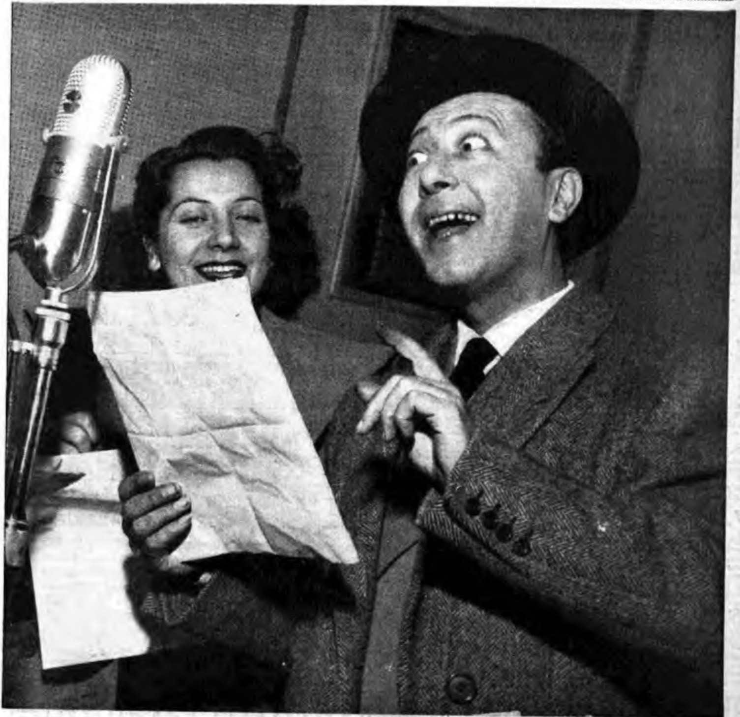
ANCHE DAVANTI AL MICROFONO MACARIO RECITA CON LA CARATTERISTICA ED ESPRESSIVA MIMICA CHE LO HA RESO UNO DEI BENIAMINI DEL PUBBLICO.