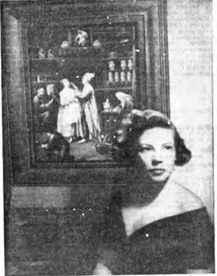
La bellezza di un viso comincia da una bocca che usa il dentifricio Durban's.

19 Concerto, 19,30 Notiziario, 19,45 Complesso Kollert-Dunham, 20 Concerto, 20,30 La scelta della musica, 20,36 Anore della musica, 20,46 Rina di Perandria, 20,50 Complesso Tini d'Alto, 20,55 Concerto sinfonico, 21,10 Atterilli, 21,22 Sing' d'Alto, 21,55 Notiziario, 22 Musica di William Walton, diretta da Sir Adrian Boult, Notiziario sinfonico, 23,10 Concerto di Stefano; Sinfonia concertata per pianoforte e orchestra; In nome della città di Londra, 23,23,15 Notiziario.