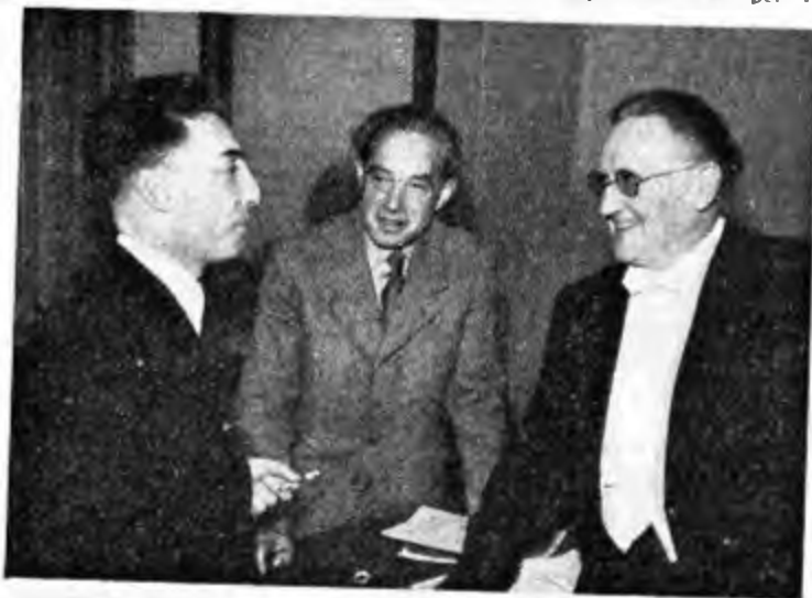
Compositori e direttori d'orchestra a Radio Torino: Da sinistra a destra: Luigi Dallapiccola, Vladimir Vogel, Hermann Scherchen.

L'unità di misura del Terzo Programma non dovrebbe essere secondo me, la trasmissione, ma la « giornata radiofonica ». Mi spiego. Il Terzo Programma, per le sue caratteristiche e per la sua finalità, verrà trasmesso soltanto in certe ore del giorno o senza interruzioni. Saranno due o tre ore di trasmissione al giorno. La disposizione dell'ascoltatore del Terzo, è sostanzialmente diversa da quella di chi ascolta il Primo o il Secondo. Questi ultimi Programmi, o si ascoltano a caso, o si ascoltano per la durata della trasmissione che risponde al proprio gusto o interesse. Il Terzo Programma presuppone, invece, un ascolto meno occasionale e meno limitato, visto che gli ascoltatori del Terzo saranno degli ascoltatori, non di « complemento », ma « effettivi ». Così come oggi incontriamo l'amico che si dice: « Vado a teatro » pur saper che in serata è indisponibile, domani do-